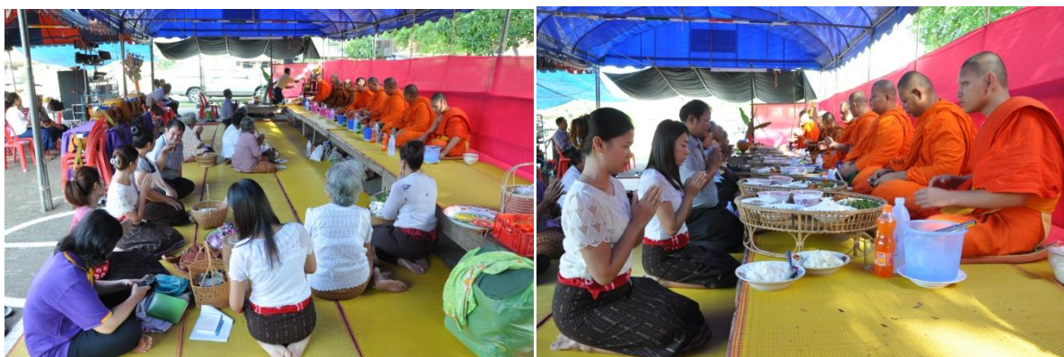
ภาพ ทำบุญเลี้ยงพระเช้า

เช้าของวันที่สอง ชาวบ้านจะนิมนต์พระภิกษุสงฆ์จำนวน ๙ รูป มาฉันภัตตาหารที่ปะรำพิธี ชาวบ้านแต่ละหลังคาเรือนจะนำข้าวปลาอาหาร และข้าวเหนียว ขนมแห้ง มาร่วมทำบุญ หลังจากที่ทำบุญเลี้ยงพระเสร็จเป็นที่เรียบร้อยแล้ว ชาวบ้านก็จะกินข้าวปลาอาหารร่วมกันถือว่าเป็นการเสร็จพิธีช่วงเช้า