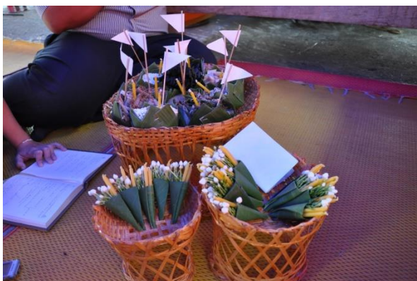
ภาพ ชั้นห้า ชั้นแปด

ชาวบ้านจะมีการกำหนดสถานที่จัดงาน และวันเวลาที่จัด จะนิยมจัดบริเวณที่เป็นพื้นที่ตรงกลางของหมู่บ้าน ซึ่งจะมีการจัดสร้างปะรำพิธีขึ้นโดยการกางเต็นท์ สิ่งของที่ใช้ในงานจะมี ดังต่อไปนี้