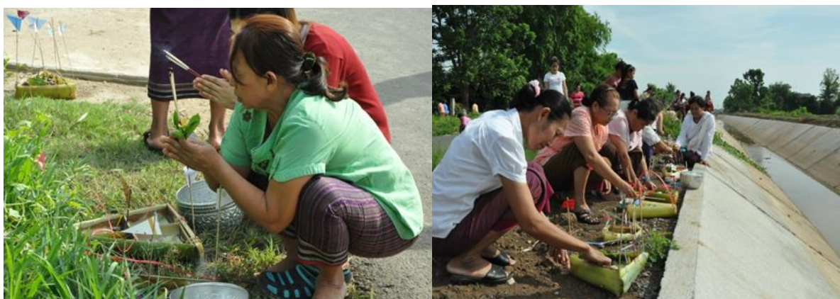
ภาพ ส่งกระทงหน้าวัดบริเวณทางสามแพร่ง

หลังจากที่ชาวบ้านส่งกระทงเสร็จเป็นที่เรียบร้อยแล้ว ก็จะร่วมกันรับประทานอาหารเช้าพร้อมหน้าพร้อมตากัน มีการพูดคุยกันสนุกสนานเฮฮา หลังจากที่แต่ละคนรับประทานอาหารเช้าเสร็จแล้ว ชาวบ้านแต่ละคนก็จะนำถังทรายที่นำมาร่วมในพิธีกลับบ้าน โดยจะนำทรายในถังไปโรยรอบบ้าน แล้วนำสายสิญจน์อ้อมบ้าน นำน้ำในขวดไปรดที่เสาบ้าน ชาวบ้านเชื่อว่าเพื่อเป็นการป้องกันกันพวกผีปีศาจไม่ให้เข้ามาภายในบ้านของตนเอง