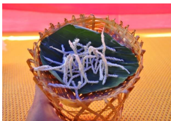
ภาพ ฟันตีนกา

ฟันตีนกา นำฝ้ายมาพันเป็นลักษณะเหมือนกับตีนของกา ไว้สำหรับเป็นใส่ของประทีปที่จะจุดตอนสวดมนต์เย็น