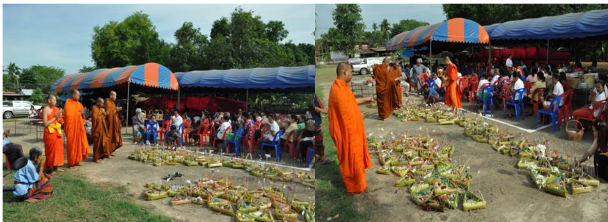
ภาพ พิธีสวดกระทงหน้าวัด

หลังจากที่ชาวบ้านส่งกระทงเสร็จเป็นที่เรียบร้อยแล้ว ก็จะร่วมกันรับประทานอาหารเช้าพร้อมหน้าพร้อมตากัน มีการพูดคุยกันสนุกสนานเฮฮา หลังจากที่แต่ละคนรับประทานอาหารเช้าเสร็จแล้ว ชาวบ้านแต่ละคนก็จะนำถังทรายที่นำมาร่วมในพิธีกลับบ้าน โดยจะนำทรายในถังไปโรยรอบบ้าน แล้วนำสายสิญจน์อ้อมบ้าน นำน้ำในขวดไปรดที่เสาบ้าน ชาวบ้านเชื่อว่าเพื่อเป็นการป้องกันกันพวกผีปีศาจไม่ให้เข้ามาภายในบ้านของตนเอง