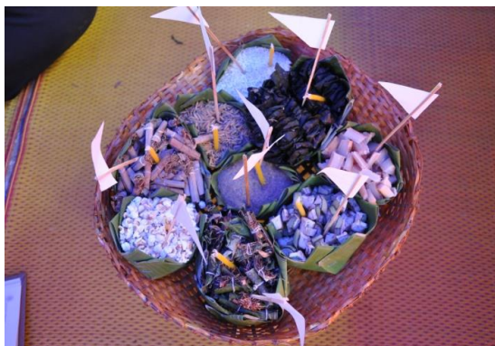
ภาพ เครื่องร้อย