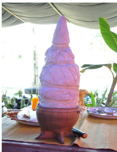
ภาพ ใส่ประทีปรูปตีนกา

ฟันตีนกา นำฝ้ายมาพันเป็นลักษณะเหมือนกับตีนของกา ไว้สำหรับเป็นใส่ของประทีปที่จะจุดตอนสวดมนต์เย็น