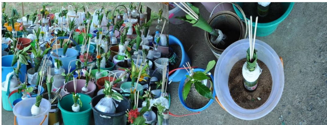
ภาพ ถังใส่ทราย กรวยดอกไม้รูปเทียน ฝ้าย ขวดน้ำ

ชาวบ้านจะมีการกำหนดสถานที่จัดงาน และวันเวลาที่จัด จะนิยมจัดบริเวณที่เป็นพื้นที่ตรงกลางของหมู่บ้าน ซึ่งจะมีการจัดสร้างปะรำพิธีขึ้นโดยการกางเต็นท์ สิ่งของที่ใช้ในงานจะมี ดังต่อไปนี้