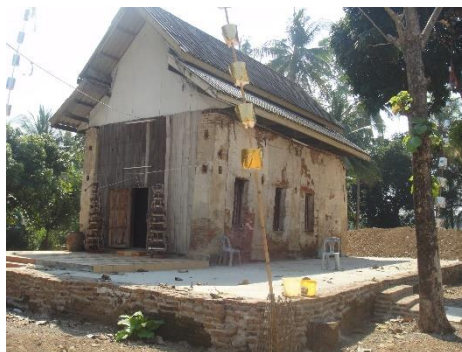
สภาพอาคารโบราณสถานที่ชาวบ้านเรียกว่า “โบสถ์ขวางตะวัน” ภายในวัดโบสถ์โพธิ์ทองในปัจจุบัน

2. วัดโบสถ์โพธิ์ทอง ตั้งอยู่ทางทิศเหนือของชุมชนบ้านนายม เป็นโบราณสถานที่มีขนาดใหญ่ที่สุดในเขตชุมชนโบราณบ้านนายม ภายในวัดพบอาคารก่อด้วยอิฐภายในประดิษฐานพระพุทธรูปปูนปั้น หันหน้าไปทางทิศเหนือ ชาวบ้านเรียกว่า “โบสถ์ขวางตะวัน” แต่จากการสำรวจและสอบถามชาวบ้านกลับพบว่ารอบๆ อาคารดังกล่าวไม่มีร่องรอยการพบชิ้นส่วนใบเสมาแต่อย่างใด อาคารหลังนี้จึงน่าจะเป็นวิหารมากกว่า ด้านหลังเจดีย์มีการพบร่องรอยของพระเจดีย์ก่ออิฐจำนวน 2 องค์