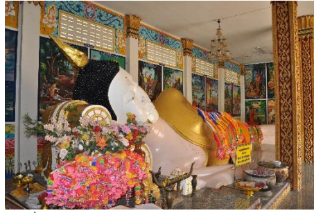
พระพุทธรูปหลวงพ่พระนั้ง และหลวงพ่พระนอน วัดพระนอน

ภายในโบสถ์วัดพระนอนเป็นที่ประดิษฐานพระพุทธรูปหลวงพ่พระนั้ง พระประธานในโบสถ์วัดพระนอนซึ่งเป็นโบราณสถานสำคัญแห่งหนึ่งในชุมชนบ้านนายม หลวงพ่พระนั้งเป็นพระพุทธรูปปูนปั้นปางมารวิชัย ลงรักปิดทอง หันพระพักตร์ไปทางทิศตะวันออก ขนาดหน้าตักกว้าง 1.50 เมตร โบสถ์วัดพระนอนสร้างอยู่บนร่องรอยซากฐานโบสถ์เดิมในปี พ.ศ. 2514 และได้รับการบูรณปฏิสังขรณ์ใหม่แล้วเสร็จในปี พ.ศ. 2555 เนื่องจากว่าพระพุทธรูปหลวงพ่พระนั้งได้รับการบูรณปฏิสังขรณ์หลายครั้ง อาจมีการซ่อมแซมจนทำให้ลักษณะทางพุทธศิลป์ถูกปรับเปลี่ยนจนเป็นลักษณะดังที่ปรากฏในปัจจุบัน จึงทำให้กำหนดอายุการสร้างได้ชัดเจน