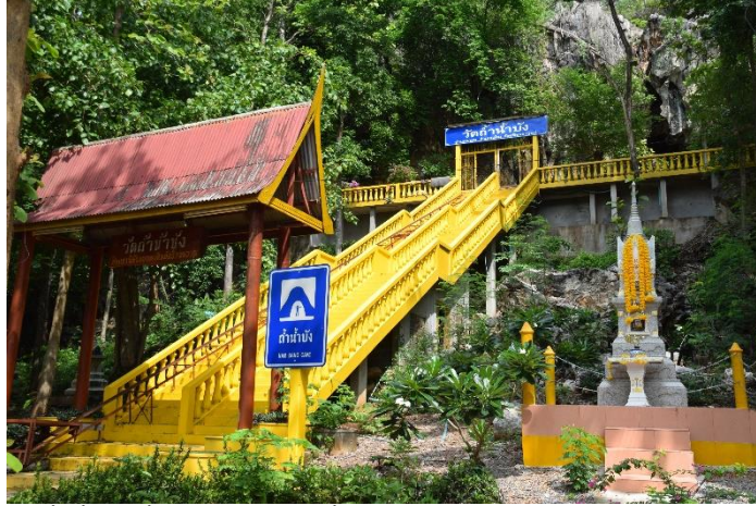
ถ้ำน้ำบั้ง ถ้ำศักดิ์สิทธิ์ริมแม่น้ำป่าสักในเขตชุมชนโบราณบ้านนายม