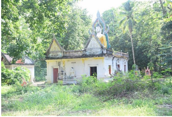
โบสถ์เก่าวัดเสาชงทอง ซึ่งชาวบ้านเล่าว่าสร้างครอบทับซากอาคารโบราณ

5. วัดเสาชงทอง ตั้งอยู่ริมคลองวังขมภูทางฝั่งขวาทางทิศตะวันตกของชุมชนบ้านนายม แต่เดิมชาวบ้านเรียกชื่อวัดว่า “วัดสะทุง” ปัจจุบันไม่พบร่องรอยโบราณสถานแล้ว เนื่องจากได้มีการสร้างอาคารครอบทับไว้