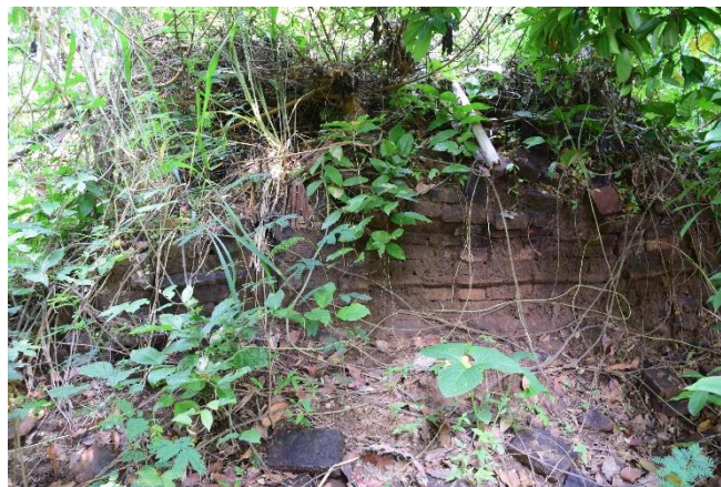
ซากฐานพระเจดีย์ก่อด้วยอิฐภายในวัดสะอาด

4. วัดสะอาด ตั้งอยู่ริมคลองวังชมภูทางฝั่งซ้ายทางทิศตะวันออกเฉียงใต้ของวัดพระนอน เดิมทีนั้นวัดสะอาดเคยเป็นวัดที่มีพระสงฆ์จำพรรษาอยู่ ต่อมาไม่มีพระสงฆ์เข้ามาจำพรรษาจึงถูกทิ้งร้าง ภายในวัดมีการพบซากฐานพระเจดีย์ก่อด้วยอิฐในผังสี่เหลี่ยม ขนาดประมาณ 3 x 3 เมตร และมีการพบบ่อน้ำโบราณในบริเวณวัดด้วย