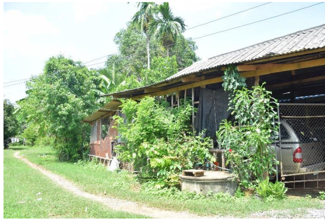
บ่อน้ำโบราณซึ่งยังเหลือเป็นสัญลักษณ์ของวัดสวนจินดา (ร้าง)

10. วัดสวนจินดา เป็นวัดร้างตั้งอยู่ริมคลองวังชมภูทางฝั่งขวา เป็นโบราณสถานที่อยู่ใกล้ปากคลองวังชมภูมากที่สุด เดิมมีซากอาคารก่อด้วยอิฐและต้นโพธิ์ขนาดใหญ่ ต่อมาถูกปรับพื้นที่จนทำให้ไม่เหลือร่องรอยโบราณสถาน ปัจจุบันเป็นที่ตั้งบ้านเรือนของชาวบ้าน แต่ยังมีบ่อน้ำโบราณเหลือเป็นสัญลักษณ์อยู่