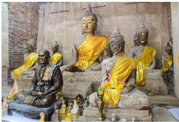
กลุ่มพระพุทธรูปปูนปั้นภายในอาคารโบราณสถานวัดโบสถ์โพธิ์ทอง

ลักษณะทางพุทธศิลป์โดยทั่วไปของพระพุทธรูปปูนปั้นภายในอาคาร ส่วนพระพักตร์ค่อนข้างเหลี่ยม พระขนงโก่ง เปลือกพระเนตรใหญ่ พระนาสิกโด่งงุ้มปลายเล็กน้อย พระโอษฐ์อ้อมค่อนข้างบาง ขมวดพระเกศาเล็กถี่ พระรัศมียาวแหลม พระวรกายสมส่วน นิ้วพระหัตถ์ทั้งสี่เรียงยาวเสมอกัน หน้าตักกว้าง สังขมาภิวาลงมาจรดพระนาภี ปลายสังขมาภีตัดตรง ที่น่าสนใจคือ พระพุทธรูปบริวารจำนวน 2 องค์ที่อยู่ของฝั่งของพระประธานในแนวระดับเดียวกัน เป็นพระพุทธรูปทรงเครื่องน้อย ทรงสวมมงกุฎซึ่งประกอบด้วยกระบังหน้าและรัดเกล้า กุณฑลและพารุรัต