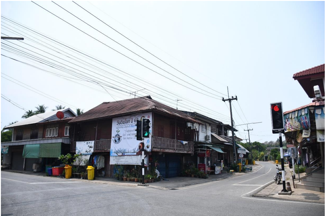
ภาพประกอบสำคัญ (ขนาด 4 x 6 นิ้ว จำนวน 2 ภาพ)