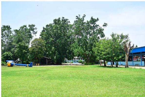
ต้นโพธิ์บริเวณวัดใหม่ (ร้าง) ภายในโรงเรียนบ้านนายม

7. วัดใหม่ เป็นวัดร้างตั้งอยู่ริมคลองวังขมภูทางฝั่งขวา ปัจจุบันเป็นที่ตั้งของโรงเรียนบ้านนายมไม่ปรากฏร่องรอยโบราณสถานแล้ว มีเพียงต้นโพธิ์ขนาดใหญ่เป็นจุดสังเกต