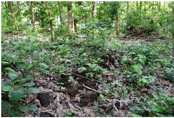
เนินดินที่มีซากอาคารและซากพระเจดีย์บริเวณวัดสะทั้น (ร้าง)

6. วัดสะทั้น เป็นวัดร้างตั้งอยู่ริมคลองวังขมภูทางฝั่งขวาทางทิศตะวันตกของชุมชนบ้านนายม ตั้งอยู่ในบริเวณวัดเสาชงทองในปัจจุบัน ชาวบ้านเข้าใจว่าเป็นวัดคู่แฝดกับวัดเสาชงทอง ดังที่มีการเรียกชื่อ “วัดสะทุง” และ “วัดสะทั้น” คู่กัน บริเวณวัดสะทั้นปรากฏเนินดินที่เป็นซากฐานอาคารก่อด้วยอิฐขนาดประมาณ 6 x 10 เมตร และยังมีซากฐานพระเจดีย์ก่อด้วยอิฐด้วย