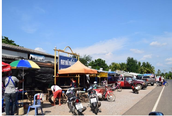
บริเวณวัดกล้วย (ร้าง) ปัจจุบันเป็นที่ตั้งตลาดโพธิ์เย็น

9. วัดกล้วย เป็นวัดร้างตั้งอยู่ริมคลองวังชมภูทางฝั่งซ้าย เดิมมีซากพระเจดีย์ก่อด้วยอิฐ ต่อมาถูกปรับพื้นที่จนทำให้ไม่เหลือร่องรอยโบราณสถาน ปัจจุบันเป็นที่ตั้งตลาดโพธิ์เย็น ซึ่งเป็นตลาดจำหน่ายสินค้าและอาคารในช่วงเย็นของชุมชนบ้านนายม