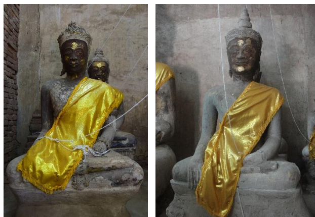
พระพุทธรูปปูนปั้นปางมารวิชัย ทรงเครื่องน้อย 2 องค์ ภายในอาคารโบราณสถานวัดโบสถ์โพธิ์ทอง

เมื่อพิจารณาลักษณะทางพุทธศิลป์ของพระพุทธรูปทรงเครื่องน้อย 2 องค์ ที่อยู่ภายในอาคารซึ่งสามารถกำหนดช่วงอายุการสร้างและศิลปะได้ค่อนข้างชัดเจน เทียบเคียงกับพระพุทธรูปศิลปะต่าง ๆ ในประเทศไทยและสมัยกรุงศรีอยุธยาแล้ว พบว่าพระพุทธรูปทรงเครื่องน้อยเป็นพระพุทธรูปที่นิยมสร้างขึ้นในสมัยอยุธยาตอนกลางหรือราวพุทธศตวรรษที่ 21 จนถึงพุทธศตวรรษที่ 22 จึงมีความเป็นไปได้ว่าบริเวณรอบ ๆ วัดโบสถ์โพธิ์ทองอาจจะมีการตั้งชุมชนขึ้นในช่วงเวลาใกล้เคียงหรือหลังจากการตั้งชุมชนที่บริเวณรอบวัดเกาะแก้วเล็กน้อย เนื่องจากงานศิลปกรรมที่พบนั้นมีอายุใกล้เคียงกัน