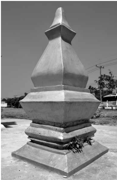
◀ เจดีย์รายทรงบัวเหลี่ยม วัดทุ่งธงไชย ตำบลหล่มเก่า อำเภอหล่มเก่า จังหวัดเพชรบูรณ์

ลุ่มแม่น้ำโขงทั้งสิ้น ชุมชนที่พบบางแห่งมีวัดและเจดีย์ขนาดใหญ่ แต่รูปแบบทางศิลปะสถาปัตยกรรมนั้นกระเตื้องไปทางศิลปะแบบล้านช้าง ในสมัยอยุธยาตั้งแต่ตอนกลางลงมาเกือบทั้งนั้น สิ่งที่น่าจะสะท้อนให้เห็นถึงความจริงในเรื่องนี้เป็นอย่างดีก็คือ ตามผิวดินของบริเวณชุมชนโบราณและวัดโบราณในลุ่มแม่น้ำป่าสักตอนนี้ไม่พบเศษภาชนะดินเผาเคลือบแบบสังคโลก และแบบเผาแกร่งที่เรียกว่าไหหินที่ผลิตจากเตาแม่น้ำน่านที่มีอายุตั้งแต่สมัยอยุธยาตอนต้นขึ้นไป ในทำนองตรงข้ามจะพบเศษภาชนะดินเผาแบบธรรมดาที่ปะปนอยู่กับเครื่องปั้นดินเผาแกร่งสีด้าบั้ง สีเทาบ้าง เป็นแบบที่พบในเขตอีสานตอนบนโดยทั่วไป