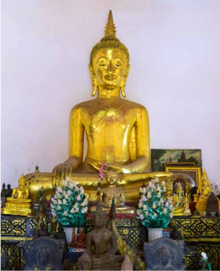
▲ พระประธานในพระวิหาร วัดไพธสณฑ์ศักราราม ตำบลวัดป่า อำเภอหล่มสัก จังหวัดเพชรบูรณ์