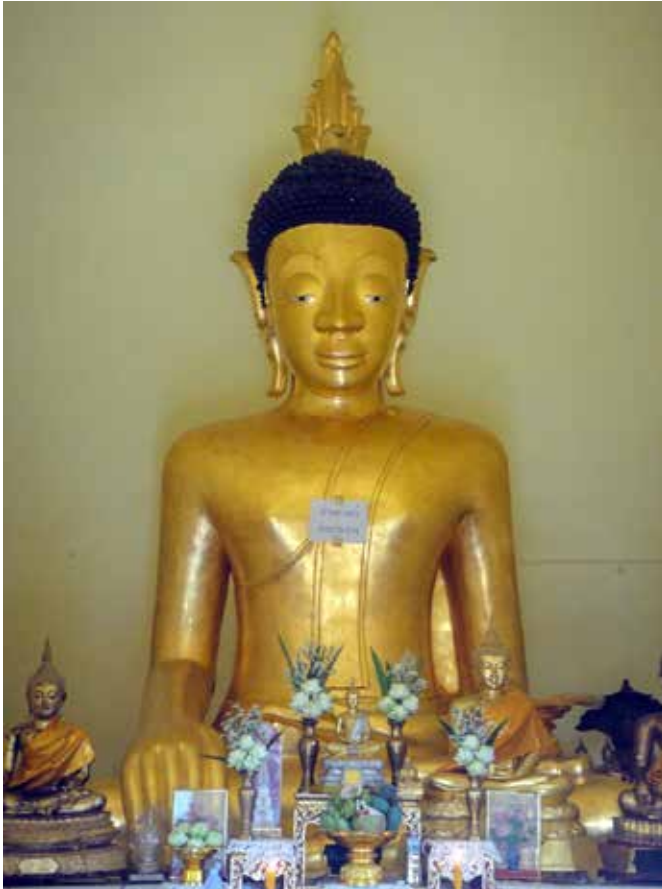
▲ พระเจ้าใหญ่วัดศรีมงคล ตำบลหล่มเก่า อำเภอหล่มเก่า

๒. พระเจ้าใหญ่วัดศรีมงคล บ้านหินกลิ้ง เป็นพระพุทธรูป ปูนปั้นปางมารวิชัย ขนาดหน้าตักกว้างประมาณ ๒.๕๐ เมตร ประดิษฐาน เป็นพระประธานอยู่ภายในสิมวัดศรีมงคล บ้านหินกลิ้ง ตำบลหล่มเก่า อำเภอหล่มเก่า จังหวัดเพชรบูรณ์