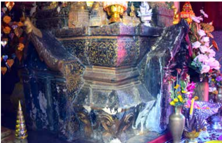
▲ ลายฟอกคำฐานชุกชีหลวงพ่อใหญ่ พระประธานในลิมวัดคิลามงคล

ลายฟอกคำ คือ การลงรักสีดำและแดงที่พื้น แล้วปิดทองลงไป ที่ตัวลวดลายคล้ายกับลายรดน้ำ จะต่างกันตรงกรรมวิธี ลายฟอกคำจะมีการทำแบบลวดลายลงบนแผ่นกระดาษก่อน แล้วตัดหรือฉลุโปร่งเป็นตัวลาย ต่อจากนั้นจึงนำขึ้นไปทาบบนผนังที่ทาร์กไว้ก่อน แล้วจึงปิดทองบริเวณที่ฉลุลายไว้ สุดท้ายก็จะได้ลวดลายตามต้องการ (ศักดิ์ชัย สายสิงห์, ๒๕๕๕ : ๒๘๒)