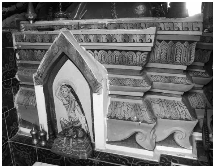
▲ ลักษณะฐานชุกชีพระประธานในสิมวัดโพธิ์ทอง ตำบลวังบาล อำเภอลำดวน จังหวัดเพชรบูรณ์

พุทธลักษณะเช่นนี้เป็นรูปแบบทางพุทธศิลป์ที่ใกล้เคียงกับพระพุทธรูปปูนปั้นที่ประทับนั่งบนฐานสิงห์อย่างมาก ในขณะที่วัดฐานชุกชีที่ประดิษฐานพระประธานองค์นี้ในปัจจุบันก็มีการทำเป็นฐานสิงห์ การประดับด้วยซุ้มหน้ามุขและประตูหลอก ๓ ด้าน เช่นเดียวกับฐานพระประธานในวิหารวัดโพธิ์ทอง แต่ไม่ปรากฏหลักฐานชัดเจนว่าเป็นฐานเดิมหรือฐานใหม่ที่ทำขึ้นพร้อมการสร้างสิมเมื่อ พ.ศ. ๒๕๒๖ ในเบื้องต้นผู้เขียนจึงจัดเป็นกลุ่มพระพุทธรูปที่มีการประดับลวดลายบนสังขมาภีและจีวร พระประธานในสิมวัดโพธิ์ทองจึงน่าจะมียุขราวพุทธศตวรรษที่ ๒๔ ร่วมสมัยกับพระประธานในวิหารวัดโพธิ์ทอง