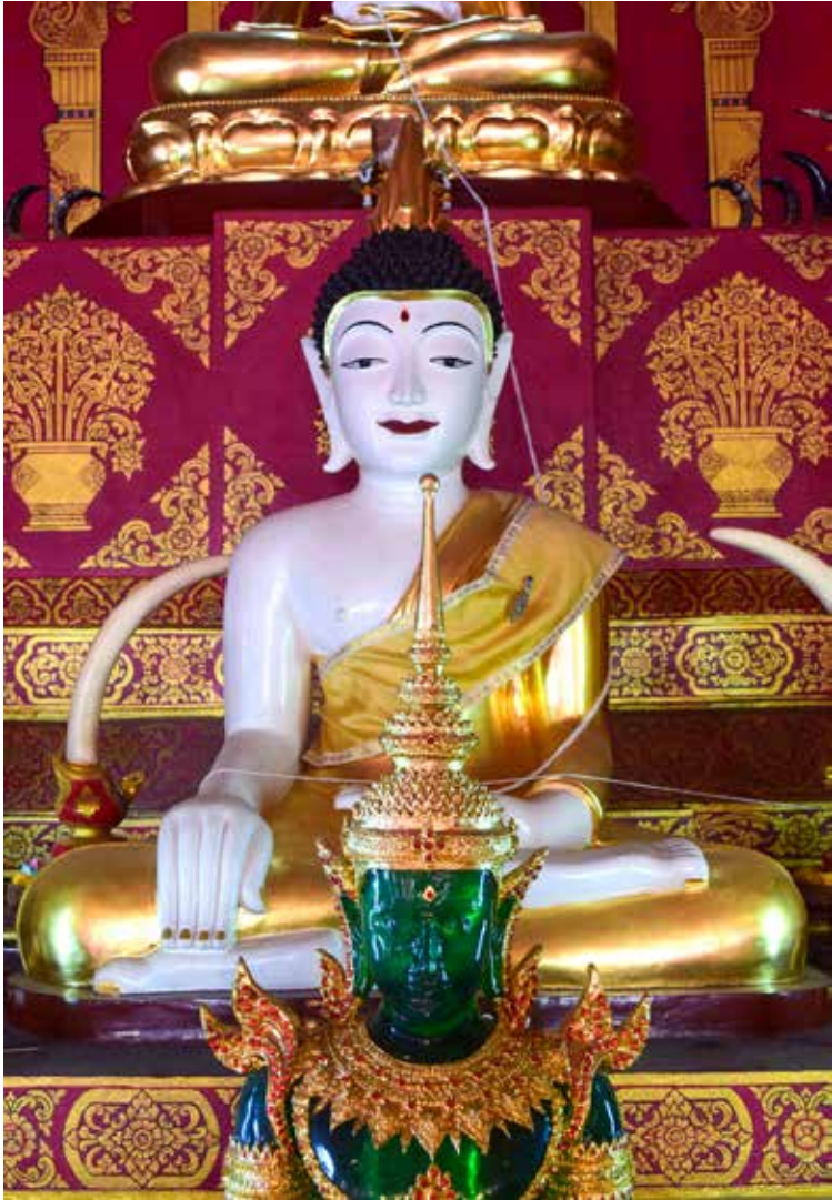
▲ รูปแบบทางพุทธศิลป์ หลวงพ่อสามพี่น้อง วัดศรีมงคล ตำบลนาเกาะ อำเภอหล่มเก่า จังหวัดเพชรบูรณ์