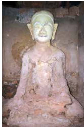
▲ อุบมุงและพระพุทธรูปปูนปั้นในอุบมุงด้านหลังพระเจ้าใหญ่องค์ตื้อ วัดศรีวิชัย