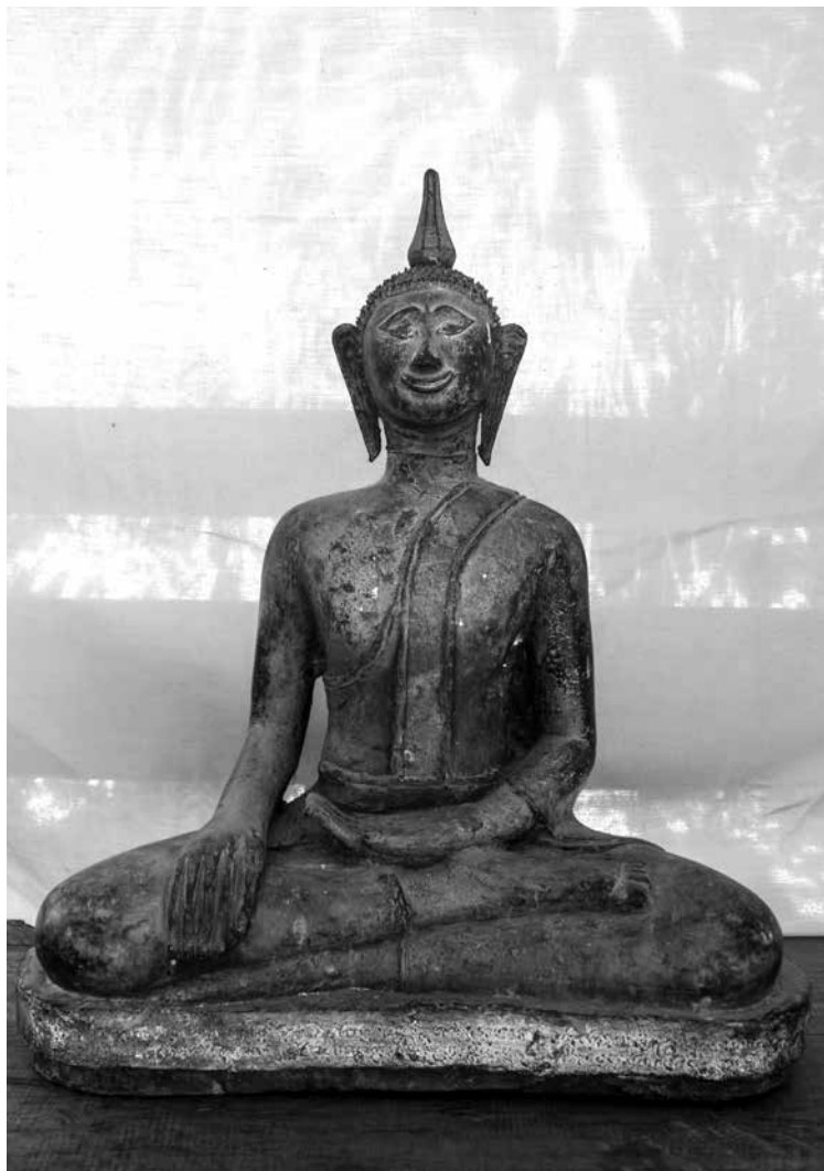
▲ พระพุทธโคดมบรมเสฏฐา วัดศรีสะอาด ตำบลตาลเดี่ยว อำเภอหล่มสัก จังหวัดเพชรบูรณ์