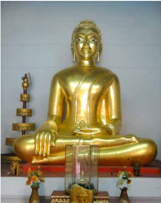
◀ พระเจ้าใหญ่ วัดศรีบุญเรือง (ร้าง) ตำบลบ้านตัว อำเภอหล่มสัก จังหวัดเพชรบูรณ์