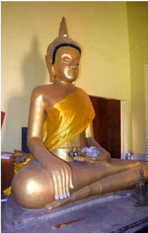
◀ พระเจ้าใหญ่วัดไตรภูมิ ตำบลสักหลง อำเภอหล่มสัก จังหวัดเพชรบูรณ์

๖. พระเจ้าใหญ่วัดไตรภูมิ เป็นพระพุทธรูปปูนปั้นปางมารวิชัย ขนาดหน้าตักกว้างประมาณ ๑.๗๐ เมตร ประดิษฐานเป็นพระประธานอยู่ภายในสิมวัดไตรภูมิ บ้านสักหลง ตำบลสักหลง อำเภอหล่มสัก จังหวัดเพชรบูรณ์