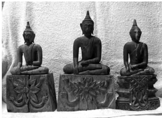
▲ พระเจ้าไม้วัดทุ่งจันทร์สมุทร ตำบลหล่มสัก อำเภอหล่มสัก จังหวัดเพชรบูรณ์

๒. พระเจ้าไม้ วัดทุ่งจันทร์สมุทร เป็นพระพุทธรูปปางมารวิชัย ขนาดเล็กจำนวน ๓ องค์ ประดิษฐานอยู่ภายในวัดทุ่งจันทร์สมุทร ตำบลหล่มสัก อำเภอหล่มสัก จังหวัดเพชรบูรณ์