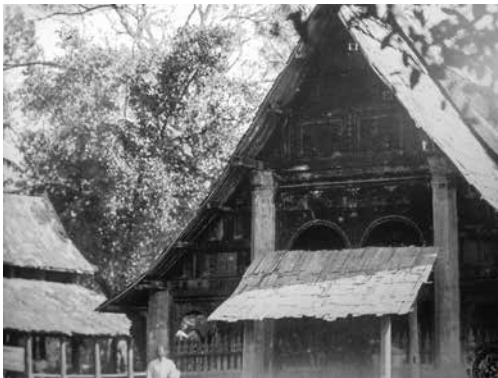
▲ วิหารหลวงวัดศรีภูมิ บ้านดัว จากภาพถ่ายเมื่อราว พ.ศ. ๒๔๕๐

นอกจากนี้ วิหารที่ประดิษฐานพระเจ้าใหญ่หลักคำ วัดศรีภูมิ ยังเคยเป็นวิหารเก่าแก่ศิลปะล้านช้างซึ่งมีรูปแบบศิลปกรรมใกล้เคียงกับสิมหรือสิมวัดเชียงทอง เมืองหลวงพระบาง (เอนก นาวิกมูล และธงไชย ลิขิตพรสวรรค์, ๒๕๖๕ : ๕๙) ก่อนที่จะได้รับการบูรณะเป็นอาคารแบบปัจจุบันในราวช่วงกลางพุทธศตวรรษที่ ๒๕ ซึ่งสะท้อนให้เห็นว่าพระเจ้าใหญ่หลักคำ วัดศรีภูมิ อาจได้รับอิทธิพลการประดับลวดลายบนองค์พระมาจากเมืองหลวงพระบางก็เป็นได้