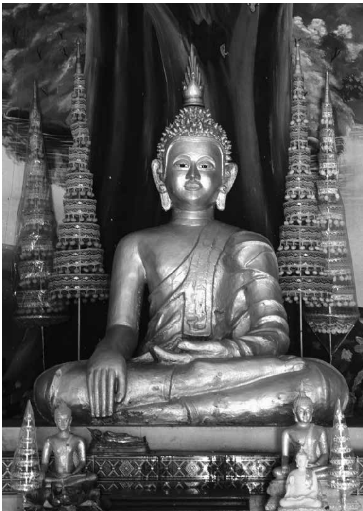
▲ พระประธานในสิมวัดศรีชมชื่น ตำบลน้ำก้อ อำเภอหล่มสัก จังหวัดเพชรบูรณ์