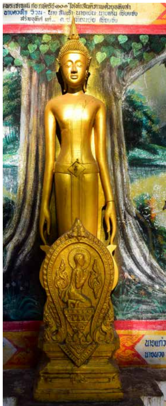
▲ พระเจ้าไม้ วัดศรีมงคล ตำบลหล่มสัก อำเภอหล่มสัก จังหวัดเพชรบูรณ์