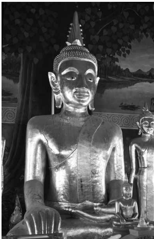
▲ พระเจ้าใหญ่วัดตาล ตำบลหล่มเก่า อำเภอหล่มเก่า

นอกจากพระเจ้าใหญ่วัดตาลแล้ว ภายในวิหารพระเจ้าใหญ่ วัดตาลยังมีพระพุทธรูปปูนปั้น ปางเปิดโลก จำนวน ๒ องค์ ประทับ ยืนคู่กันอยู่ด้านข้างองค์พระเจ้าใหญ่วัดตาล และมีพระพุทธรูปปูนปั้น ปางไสยาสน์ ประดิษฐานอยู่ด้านหน้าพระเจ้าใหญ่วัดตาล พระพุทธรูป ปูนปั้นทั้งสามองค์นี้โดยรวมมีรูปแบบทางพระพุทธรูปศิลป์เป็นพระ พุทธรูปศิลปะล้านช้าง สันนิษฐานว่าถูกสร้างขึ้นภายหลังพระเจ้าใหญ่ วัดตาลไม่นานนัก กำหนดอายุราวต้นพุทธศตวรรษที่ ๒๔