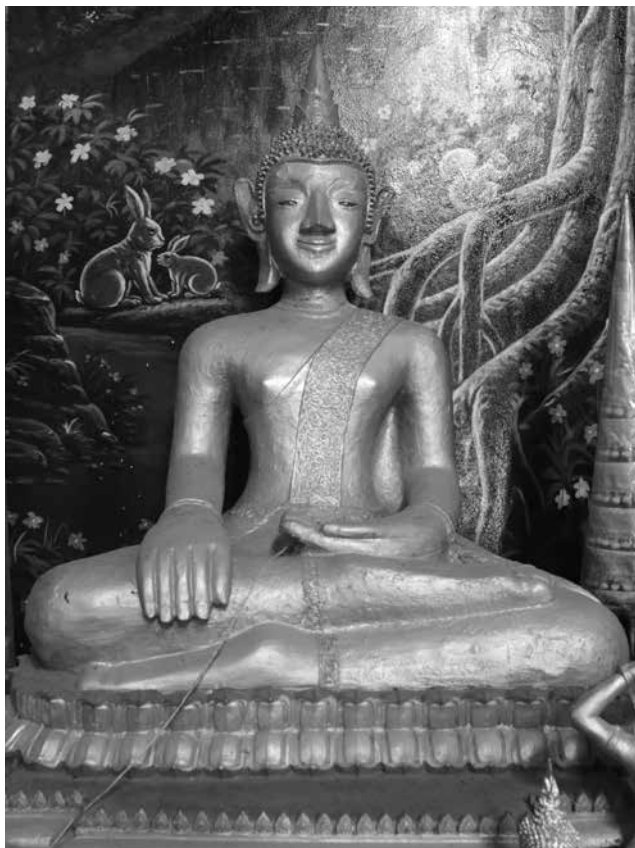
▲ พระประธานองค์เก่าในสิมวัตศรีฐานปิยาราม ตำบลวังบาล อำเภอลำหม่อมเก่า จังหวัดเพชรบูรณ์

๒. พระประธานองค์เก่าในสิมวัตศรีฐานปิยาราม เป็นพระพุทธรูปปูนปั้นปางมารวิชัย ขนาดหน้าตักกว้างประมาณ ๑.๓๐ เมตร ประดิษฐานอยู่ภายในสิมวัตศรีฐานปิยาราม บ้านวังบาล ตำบลวังบาล อำเภอลำหม่อมเก่า จังหวัดเพชรบูรณ์