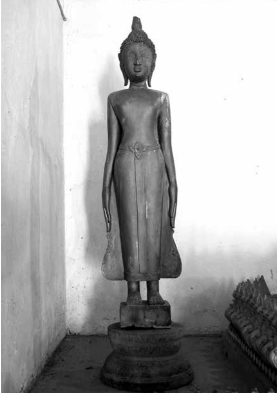
▲ พระเจ้าไม้วัดศรีไวย์ ตำบลบ้านเนิน อำเภอหล่มเก่า จังหวัดเพชรบูรณ์

๔. พระเจ้าไม้ในสิมวัดศรีบุญเรือง บ้านอุ่มกะทาด เป็นพระพุทธรูปยืนปางประทานพร ขนาดความสูงรวมฐานประมาณ ๑.๘๐ เมตร ประดิษฐานอยู่ในสิมวัดศรีบุญเรือง บ้านอุ่มกะทาด ตำบลศิลา อำเภอหล่มเก่า จังหวัดเพชรบูรณ์ บริเวณรั้วประตูด้านหน้าและชายจีวรด้านข้างมีการแกะสลักลายสวยงาม ตรงกลางพระอุระมีร่องรอยการเจาะเป็นช่องเพื่อบรรจุพระธาตุ วัตถุมงคลหรือของมีค่าไว้ในองค์พระ พระพุทธรูปองค์นี้เป็นที่เคารพศรัทธาของชาวบ้านอุ่มกะทาดเป็นอย่างมาก (พระอธิการนิกร กิติโก, สัมภาษณ์) กำหนดอายุราวปลายพุทธศตวรรษที่ ๒๔ ถึงต้นพุทธศตวรรษที่ ๒๕