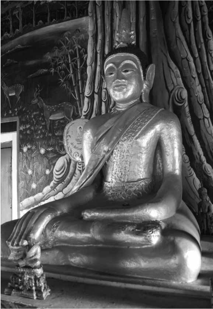
▲ พระประธานในสิมวัตโพธิ์ทอง บ้านน้ำครึ่ง ตำบลวังบาล อำเภอหล่มเก่า จังหวัดเพชรบูรณ์