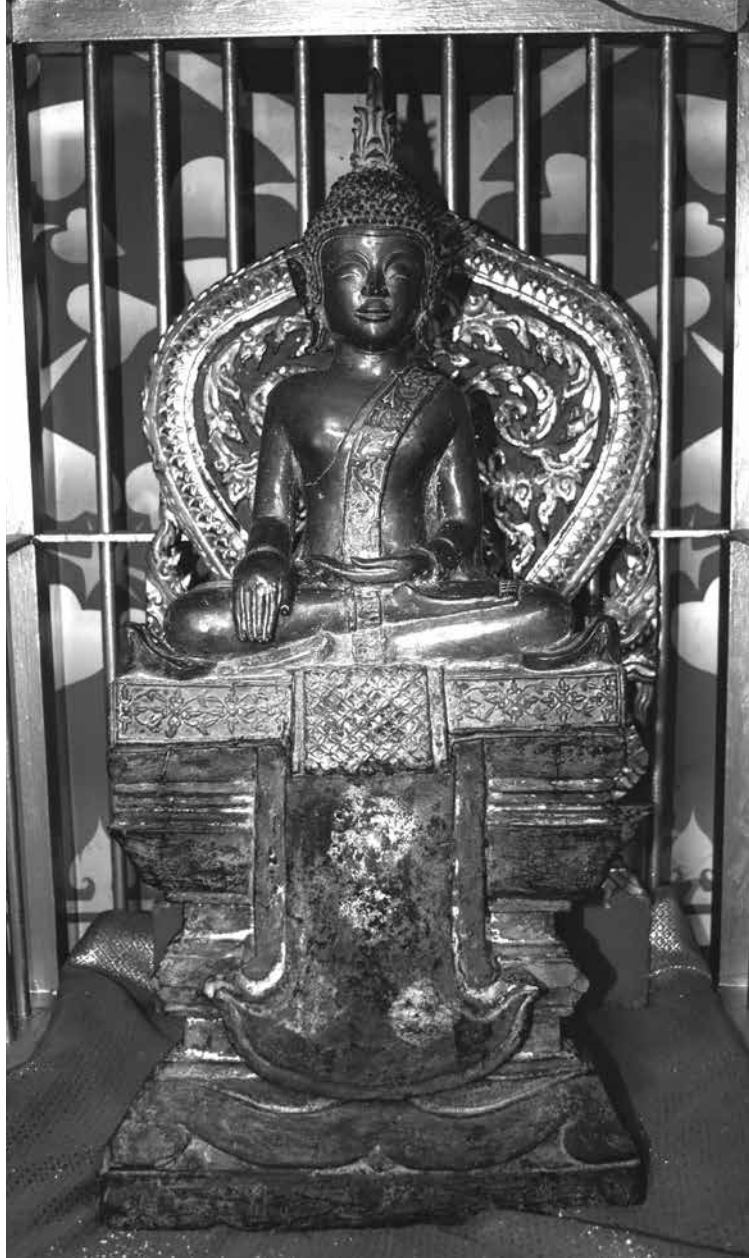
▲ พระพุทธรูปนิมิตมงคล วัดศรีฐานปิยาราม ตำบลวังบาล อำเภอหล่มเก่า จังหวัดเพชรบูรณ์