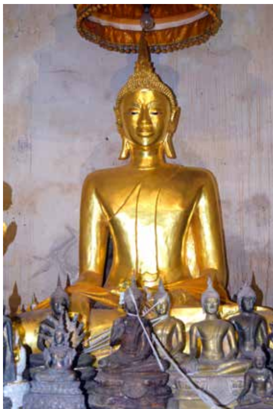
◀ หลวงพ่อรุ่งเรือง วัดศรีบุญเรือง ตำบลหล่มสัก อำเภอหล่มสัก จังหวัดเพชรบูรณ์