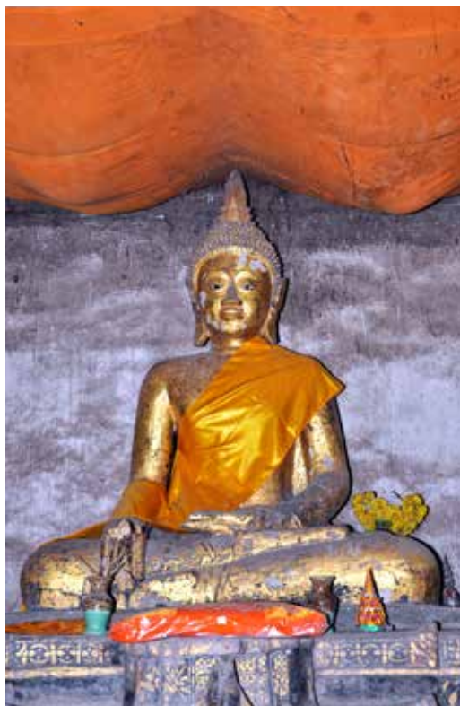
◀ พระประธาน ในวิหารวัดโพธิ์ทอง บ้านน้ำครั่ง ตำบลวังบาล อำเภอหล่มเก่า จังหวัดเพชรบูรณ์

๑. พระประธานในวิหารวัดโพธิ์ทอง เป็นพระพุทธรูปปูนปั้นปางมารวิชัย ขนาดหน้าตักกว้างประมาณ ๑.๔๐ เมตร ประดิษฐานเป็นพระประธานอยู่ภายในวิหารวัดโพธิ์ทอง บ้านน้ำครั่ง ตำบลวังบาล อำเภอหล่มเก่า จังหวัดเพชรบูรณ์