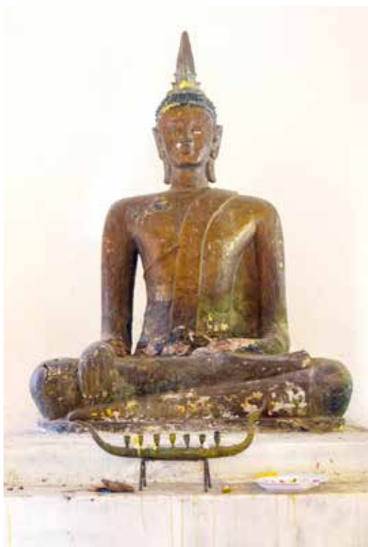
◀ หลวงปู่ธรรม วัดศรีชะเกตุ ตำบลบ้านโสก อำเภอหล่มสัก จังหวัดเพชรบูรณ์