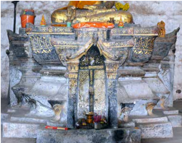
▲ รูปแบบฐานชุกชีพระประธานในวิหารวัดโพธิ์ทอง ตำบลวังบาล อำเภอลำหมั่งแก้ว จังหวัดเพชรบูรณ์

พระประธานในวิหารวัดโพธิ์ทอง มีพุทธลักษณะพระพักตร์ ป้อมกลม พระเนตรเปิดมองตรง ขมวดพระเกศาเล็กและแหลม พระรัศมีขนาดใหญ่ทรงเปลว พระโอษฐ์เล็ก ริมฝีพระโอษฐ์ล่างหนา พระนาสิกใหญ่และมีสันพระนาสิก สันขาภิเป็นแผ่นใหญ่ปลายตัดตรงจรดพระนาภี พระหัตถ์ค่อนข้างใหญ่ พระวรกายค่อนข้างอวบไม่สมส่วน ขัดสมาธิราบ พระหัตถ์ขวาวางเหนือพระชานุขวา ส่วนพระหัตถ์ซ้ายวางเหนือพระเพลา ลักษณะพุทธศิลป์เช่นนี้เป็นรูปแบบที่ถูกจัดเป็นพระพุทธรูปศิลปะพื้นบ้านที่เป็นงานช่างพื้นบ้านลาว - อีสานอย่างแท้จริง ซึ่งรูปแบบเช่นนี้มีอายุราวปลายพุทธศตวรรษที่ ๒๓ ถึงต้นพุทธศตวรรษที่ ๒๔ (มณฑล ปรากฏการเกียรติ, ๒๕๕๖ : ๑๕๓)