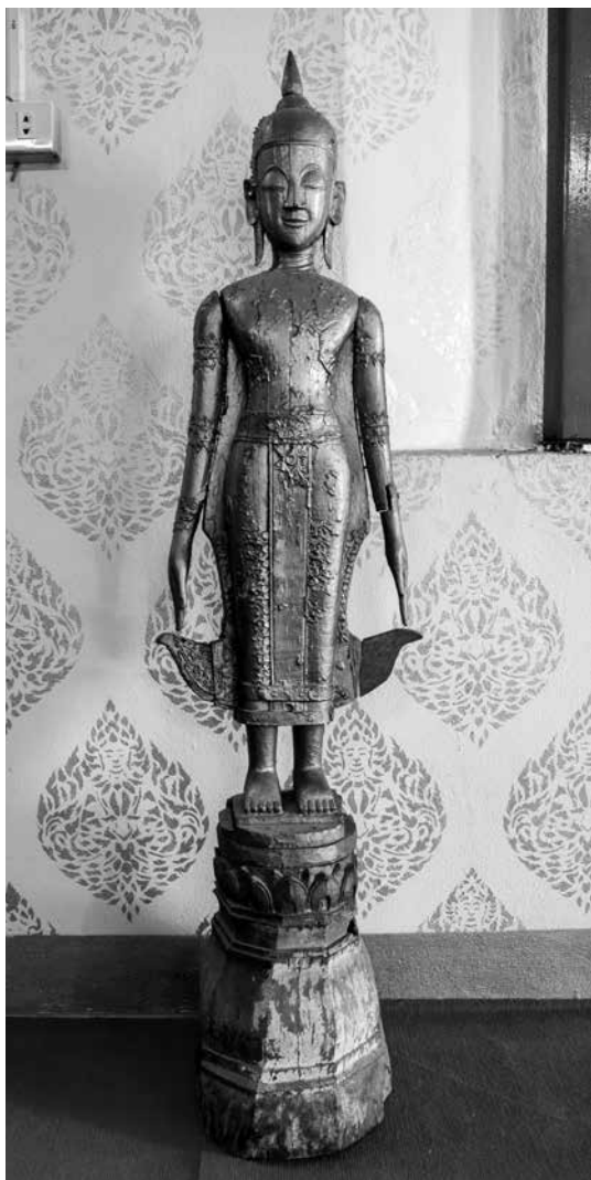
◀ พระเจ้าไม้ วัดศรีสุมังค์ ตำบลหล่มเก่า อำเภอหล่มเก่า จังหวัดเพชรบูรณ์

๑. พระเจ้าไม้ วัดศรีสุมังค์ เป็นพระพุทธรูปยืน ปางเปิดโลก ขนาดความสูงรวมฐานประมาณ ๑.๔๐ เมตร ประดิษฐานอยู่ภายใน สิมวัดศรีสุมังค์ บ้านศรีสุมังค์ ตำบลหล่มเก่า อำเภอหล่มเก่า จังหวัด เพชรบูรณ์