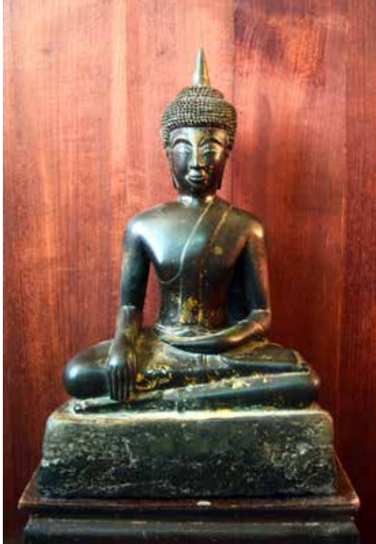
▲ หลวงพ่อพระเสี้ยววัดทุ่งธงไชย ตำบลหล่มเก่า อำเภอหล่มเก่า จังหวัดเพชรบูรณ์

พระกรรมแนบชิดกับพระเศียร สังฆาฏิพาดยาวจรดพระนาภี พระหัตถ์ขวาวางเหนือพระชานุขวา ส่วนพระหัตถ์ซ้ายวางเหนือพระเพลา เมื่อพิจารณาจากรูปแบบทางพุทธศิลป์เทียบได้กับกลุ่มพระพุทธรูปสำริดศิลปะล้านช้างที่กำหนดอายุราวปลายพุทธศตวรรษที่ ๒๓ - ๒๔