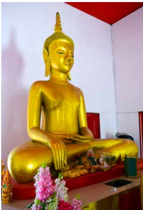
◀ พระเจ้าใหญ่ วัดศรีสะอาด ตำบลตาลเดี่ยว อำเภอห่มสีก จังหวัดเพชรบูรณ์

พระเจ้าใหญ่วัดศรีสะอาด มีพุทธลักษณะพระพักตร์เรียวยาวผดพระเกศาเล็กและแหลม พระกรรณยาว พระรัศมีทรงเปลว พระโอษฐ์เล็ก พระนาสิกเล็ก สังขารเป็นแผ่นใหญ่ปลายตัดตรงจรดพระนาภี พระหัตถ์ค่อนข้างใหญ่ ชัดสมาธิราบ พระหัตถ์ขวาวางเหนือพระชานุขวา ส่วนพระหัตถ์ซ้ายวางเหนือพระเพลารูปแบบทางพุทธศิลป์เช่นนี้ใกล้เคียงกับพระพุทธรูปปูนปั้นหลายองค์ในเขตเมืองอุบลราชธานี พระเจ้าใหญ่วัดศรีสะอาดน่าจะสร้างขึ้นในราวช่วงปลายพุทธศตวรรษที่ ๒๔ หลังการย้ายศูนย์กลางเมืองห่มสีกจากบริเวณลุ่มแม่น้ำพุงมายังริมฝั่งแม่น้ำป่าสัก