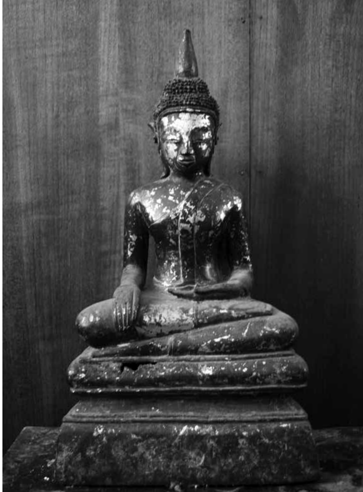
▲ พระพุทธรูปสำริด วัดทุ่งธงไชย (๒) วัดทุ่งธงไชย ตำบลหล่มเก่า อำเภอหล่มเก่า จังหวัดเพชรบูรณ์

๔. พระพุทธรูปสำริดวัดทุ่งธงไชย (๒) เป็นพระพุทธรูปสำริด ปางมารวิชัย ขนาดหน้าตักกว้าง ๑๕.๕ เซนติเมตร ฐานกว้าง ๑๙ เซนติเมตร ความสูงรวมฐาน ๓๔ เซนติเมตร ประดิษฐานอยู่ภายในวัดทุ่งธงไชย ตำบลหล่มเก่า อำเภอหล่มเก่า จังหวัดเพชรบูรณ์