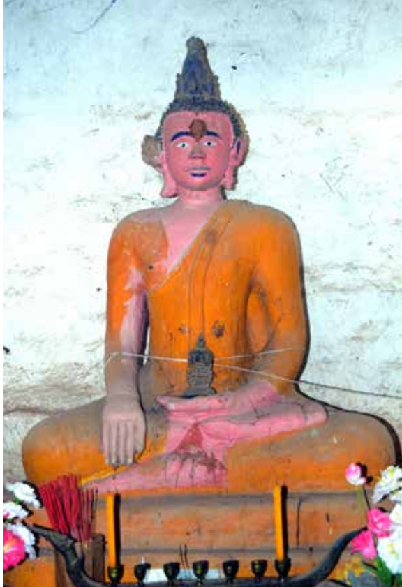
▲ พระประธานในสิมวัตศรีบุญเรือง ตำบลนาข่า อำเภอหล่มเก่า จังหวัดเพชรบูรณ์