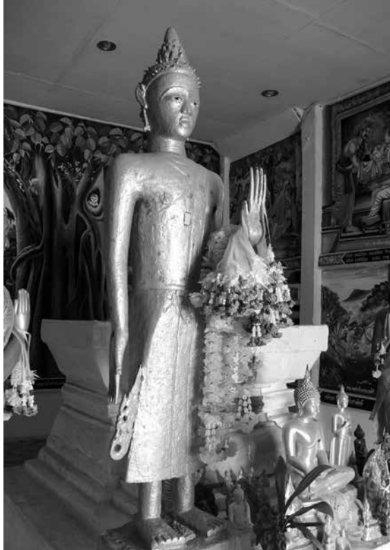
พระเจ้าไม้ในสิมวัตศรีบุญเรือง ตำบลศิลา อำเภอห่มเกล้า จังหวัดเพชรบูรณ์ ▲

กลุ่มพระพุทธรูปประทับนั่ง ส่วนใหญ่จะมีพุทธลักษณะใกล้เคียงกับพระพุทธรูปล้านช้างทั่วไป และจะมีรายละเอียดที่ต่างกันไปตามฝีมือและจินตนาการของช่าง บางส่วนจะมีการแกะสลักหรือเขียนชื่อผู้สร้างไว้ที่ฐาน