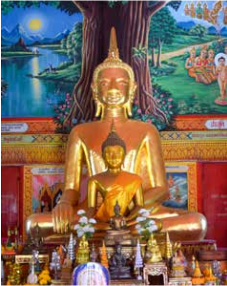
◀ พระพุทธชัยมงคล วัดศรีมงคล ตำบลหล่มสัก อำเภอหล่มสัก จังหวัดเพชรบูรณ์

๘. พระพุทธชัยมงคล เป็นพระพุทธรูปปูนปั้นปางมารวิชัย ลงรักปิดทองทั้งองค์ ขนาดหน้าตักกว้างประมาณ ๓ เมตร ประดิษฐานเป็นพระประธานอยู่ภายในสิมวัตศรีมงคล หรือวัดกลาง ตำบลหล่มสัก อำเภอหล่มสัก จังหวัดเพชรบูรณ์