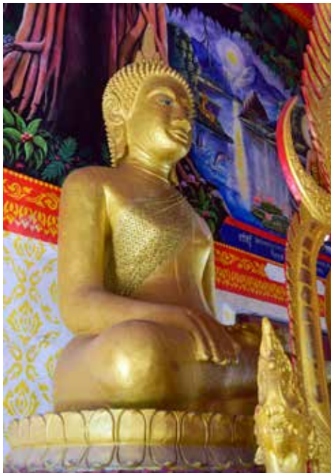
◀ พระประธานในสิม วัดสว่างอารมณ์ ตำบลบ้านโสก อำเภอหล่มสัก จังหวัดเพชรบูรณ์

๘. พระประธานในสิมวัดสว่างอารมณ์ เป็นพระพุทธรูปปูนปั้นปางมารวิชัย ขนาดหน้าตักกว้างประมาณ ๑.๕๐ เมตร ประดิษฐานเป็นพระประธานอยู่ภายในสิมวัดสว่างอารมณ์ (น้ำล้อม) บ้านนาหลวง ตำบลบ้านโสก อำเภอหล่มสัก จังหวัดเพชรบูรณ์ สามารถกำหนดอายุราวต้นพุทธศตวรรษที่ ๒๕