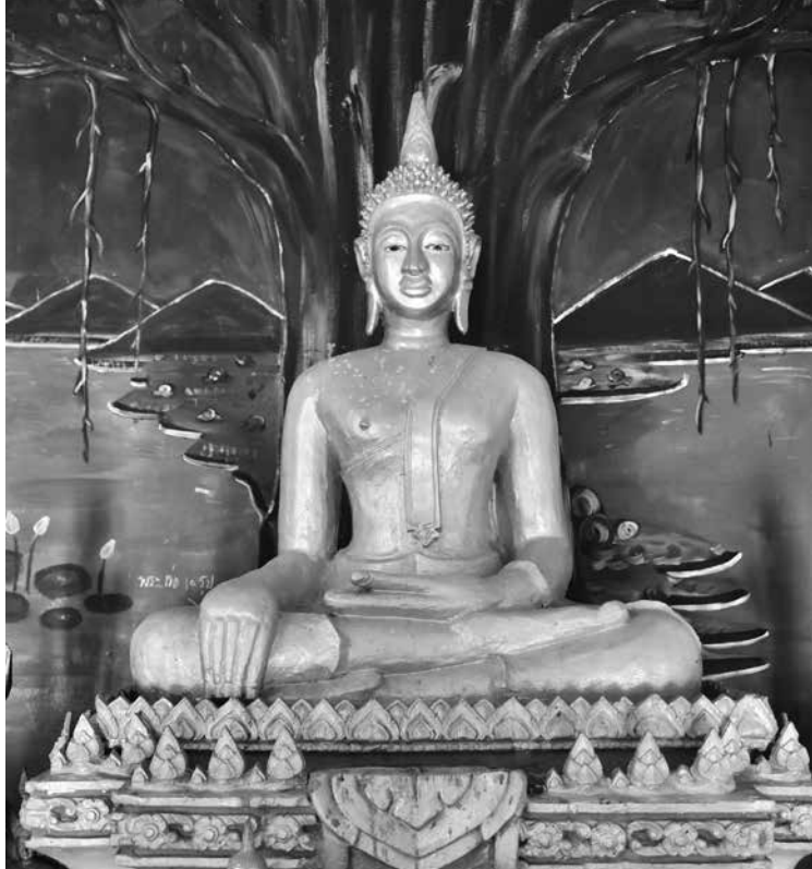
▲ พระประธานในสิมวัตขามซุม ตำบลบ้านเนิน อำเภอหล่มเก่า จังหวัดเพชรบูรณ์

๑๗. พระประธานในสิมวัตขามซุม เป็นพระพุทธรูปปูนปั้นปางมารวิชัย ขนาดหน้าตักกว้างประมาณ ๑.๑๐ เมตร ประดิษฐานเป็นพระประธานอยู่ภายในสิมวัตขามซุม บ้านพร้าว ตำบลบ้านเนิน อำเภอหล่มเก่า จังหวัดเพชรบูรณ์ พระประธานในสิมวัตขามซุมถือเป็นพระพุทธรูปศักดิ์สิทธิ์ ชาวบ้านมักจะมาขอพรและถวายเครื่องสักการบูชาในช่วงวันพระ (พระสงวน อุชฺฐิจิตโต, สัมภาษณ์) จากรูปแบบพุทธศิลป์สันนิษฐานว่าสร้างขึ้นในช่วงครึ่งหลังของพุทธศตวรรษที่ ๒๕