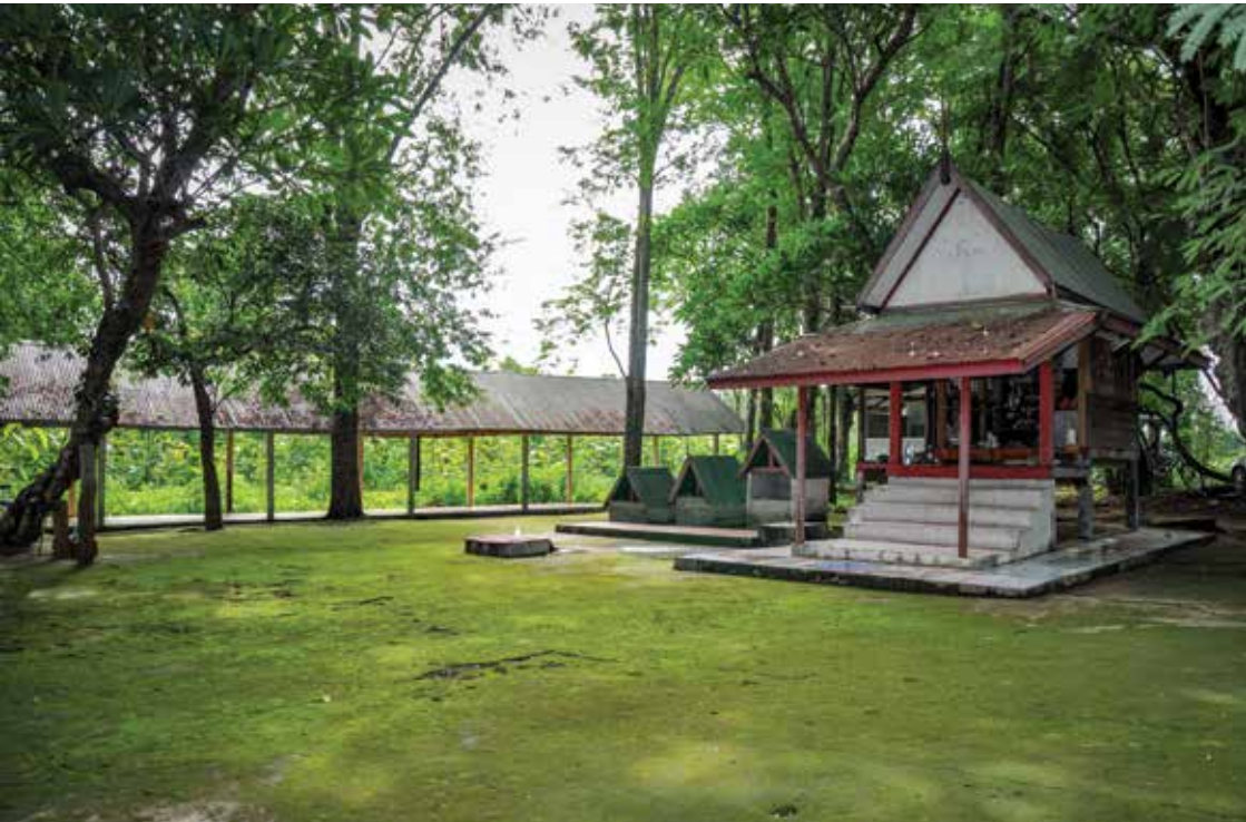
ศาลเจ้าพ่ออุ้มคำ - เจ้าแม่อุ้มแก้ว ▲

ศาลเจ้าพ่ออุ้มคำเจ้าแม่อุ้มแก้ว ตั้งอยู่ที่ ๓ ซึ่งเป็นพื้นที่สาธารณะประโยชน์ของหมู่บ้าน ภายในบริเวณจะมีลานสำหรับประกอบพิธีกรรมที่แลดูสะอาดสะอ้าน บรรยากาศร่มรื่น และล้อมรอบไปด้วยต้นไม้ขนาดใหญ่ ซึ่งทำให้ทราบได้ว่าได้รับการดูแลเป็นอย่างดี และบริเวณรอบๆ ลานมีสิ่งปลูกสร้างที่สำคัญ คือ