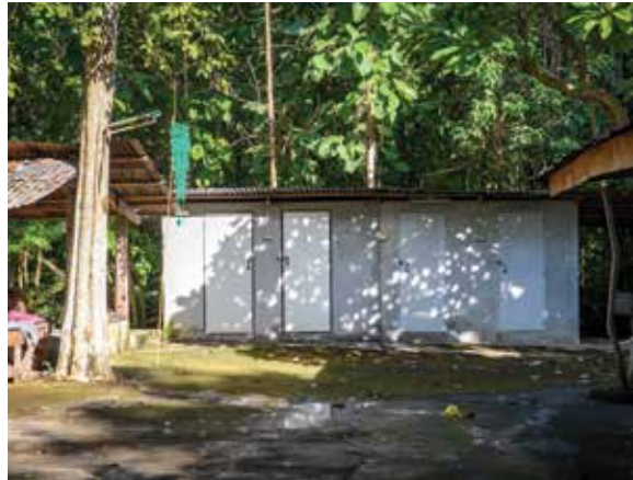
โรงครัว ▲ ▲ ห้องน้ำและห้องอาบน้ำ