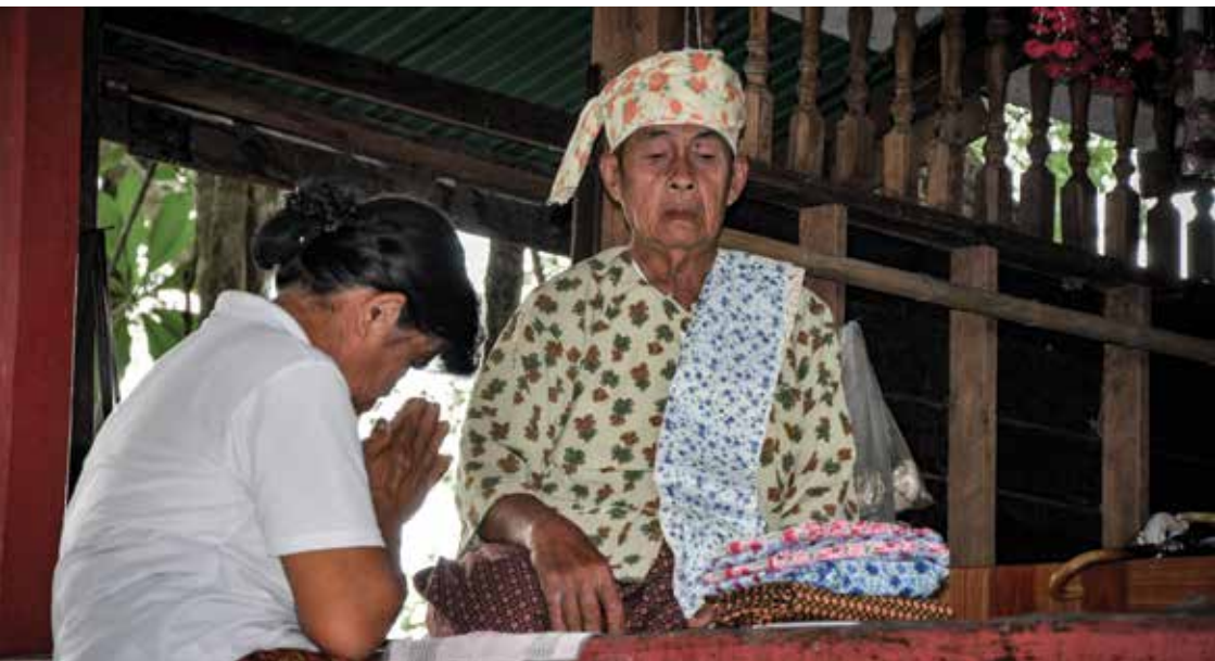
ช่างทรงใหม่เข้าไปสนทนากับเจ้าพ่ออยู่คำ ▲

ส่วนเจ้าพ่อเจ้าแม่ที่มาร่วมงานเมื่อแต่งตัวเสร็จแล้ว ก็จะเข้าไปกราบเจ้าพ่ออยู่คำตามลำดับอาวุโสจนครบทุกคน คนที่เข้าไปกราบคนสุดท้ายจะเป็นช่างทรงคนใหม่ ขณะที่ช่างทรงคนใหม่เข้าไปกราบเจ้าพ่ออยู่คำ ก็จะพูดคุยถามไถ่ “ว่าชื่ออะไร มาจากที่ไหน แล้วจะมาอยู่กับช่างทรงคนนี้นานแค่ไหน” เมื่อสนทนาจนได้ความแล้ว ก็จะออกไปร้ายรำกับบรรดาเจ้าพ่อเจ้าแม่องค์อื่นๆ ขณะที่ร้ายรำนั้นเจ้าองค์ใหม่ที่มาประทับช่างทรงจะเลือกเจ้าหนึ่งองค์เพื่อเป็นผู้นำหน้าที่ถือร่มในขบวนแห่ขันหมาก (ชาวบ้านเรียกว่า เพื่อนเจ้าบ่าว)