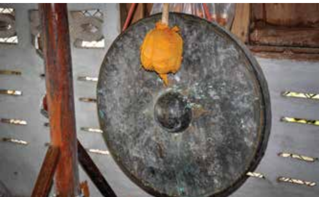
ฆ้องโหม่ง ▼

กลุ่มคนที่มีความสามารถในการเล่นเครื่องดนตรีที่ใช้ในการประกอบพิธีกรรมกินตองและพิธีกรรมอื่นๆ ในระบบความเชื่อเรื่องเจ้าพ่อเจ้าแม่ ประกอบไปด้วย กลอง ฆ้องโหม่ง ฉาบเล็ก ฉาบใหญ่