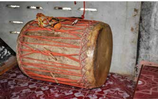
กลอง ▲ ▲ ฉาบ