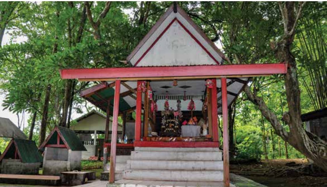
▲ หอเลี้ยง

๑) หอเลี้ยง มีลักษณะคล้ายบ้านไม้ทรงไทยหลังเล็ก ยกสูงจากพื้นดินประมาณ ๑.๕๐ เมตร ปลูกด้วยเสา ๘ ต้น มุงด้วย หลังคาจั่ว มีบันไดก่อด้วยปูนด้านหน้า ด้านขวามุงหลังคาแบบเพิงมี พื้นสำหรับวางเครื่องเช่นไห้ว ด้านบนศาลามีพื้นที่สำหรับหนึ่งคนนั่ง ได้ภายในมีโต๊ะหมู่บูชา เชิงเทียน กระจ่างรูป แจกันดอกไม้ ดาบ ไม้ เรียวหวาย เบาะรองนั่งพร้อมหมอนอิง และเต็มไปด้วยพวงมาลัย ดอกไม้ที่ชาวบ้านนำมาถวาย หอเลี้ยงมีไว้สำหรับอัญเชิญเจ้าองค์ใหญ่ มาประทับร่าง และรับเครื่องเช่นไห้ว และให้ร่างทรงของเจ้าพ่ออยู่คำ หรือเจ้าพ่อหลวงพิชัย นั่งเป็นประธานในการประกอบพิธีกรรมต่างๆ รวมถึงพิธีกินตองด้วย