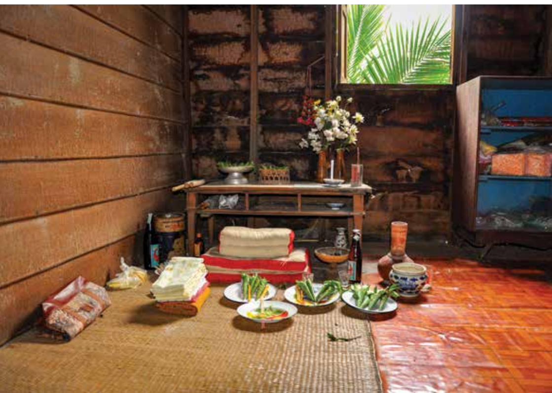
▲ ครอง หรือที่สถิตของเจ้าพ่อเจ้าแม่

๓. ครอง คนที่เป็นร่างทรงทุกคนจะต้องมีครองอยู่ที่บ้านของผู้รับเป็นร่างทรง ซึ่งเป็นที่สถิตของเจ้าพ่อเจ้าแม่ประจำร่างของตน รับร่างทรงใหม่เมื่อเสร็จพิธีกินตองแล้วจะต้องมาประกอบพิธีกรรมที่ครองในบ้านของตน เรียกว่าการ “ขึ้นครองนาย” เพื่ออัญเชิญเจ้าประจำร่างทรงคนใหม่มาสถิตอยู่ที่ครองนี้ และปิดรั้วความสิ่งชั่วร้ายภายในบ้านของร่างทรงใหม่