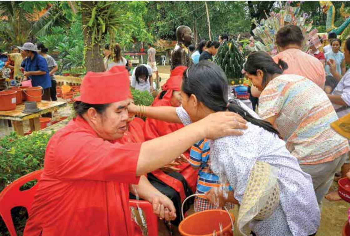
งานสงฆ์น้ำเจ้าพ่อเจ้าแม่ ▲