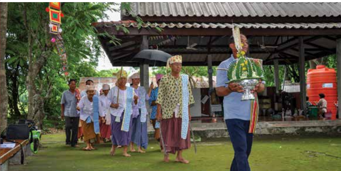
▲ เจ้าร่างทรงใหม่ร้ายรำกับเจ้าพ่อเจ้าแม่องค์อื่นๆ

๕. การแห่ขบวนขันหมาก เมื่อเลือกเจ้าที่จะเป็นเพื่อนเจ้าบ่าวได้แล้ว เจ้าในร่างทรงคนใหม่จะเข้าไปกราบเจ้าพ่ออู่คำ จากนั้นเจ้าพ่อขุนไทรก็จะหยิบยอดอ้อย พวงข้าวต่อนแต่น ที่อยู่ในจานส่งให้กับเจ้าร่างทรงคนใหม่ถือ แล้วจึงเริ่มตั้งขบวนแห่ขันหมาก โดยให้กวนจ้ำหนึ่งคนเป็นผู้ถือพานบายศรีเดินนำหน้าขบวน ตามด้วยเจ้าพ่ออู่คำซึ่งจะถือดาบ ๑ คู่ เจ้าพ่อขุนไทรถือไม้เรียวหวาย ๑ อัน และตามด้วยเจ้าร่างทรงคนใหม่เดินคู่กับเจ้าที่เป็นเพื่อนเจ้าบ่าวและเจ้าพ่อเจ้าแม่องค์อื่นๆ จะถือเทียนองค์ละ ๑ เล่ม เดินร่วมไปในขบวนด้วย โดยขันหมากจะเริ่มตั้งขบวนแห่กันที่หอเลี้ยงแล้วจึงแห่วนไปทางด้านซ้าย โดยจะเดินทั้งหมด ๓ รอบ และจะมีการให้ร้องตลอดการแห่แล้วขบวนจะไปหยุดที่ศาลาจัดเครื่องเช่นไหว้