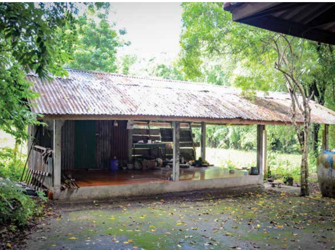
▲ ศาลาประกอบอาหาร

๖) ศาลาประกอบอาหาร จะอยู่ด้านหลังของศาลาที่ใช้ จัดเครื่องเช่นไห้ว มีไว้สำหรับประกอบอาหารควหาวนต่างๆ ที่จะใช้ ในงานพิธี