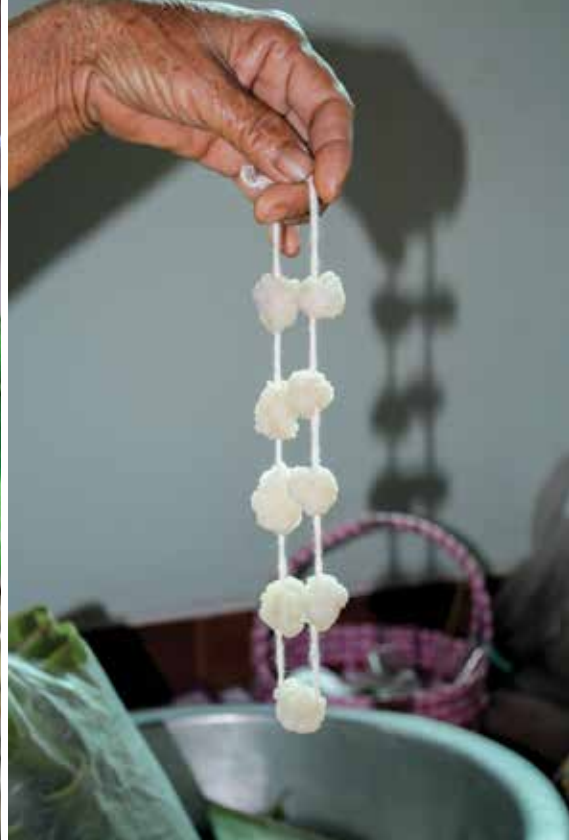
เทียนครอง ▲ ▲ พวงข้าวตอนแต่น

๖. เทียนครอง เทียนที่ได้จากรังผึ้ง โดยผ่านกระบวนการเคี่ยวในกระทะจนข้นพอปั้นได้ แล้วนำมาปั้นเป็นแท่งโดยใช้ฝ้ายเป็นไส้ของเทียน เพื่อใช้ประกอบในชั้นครอง