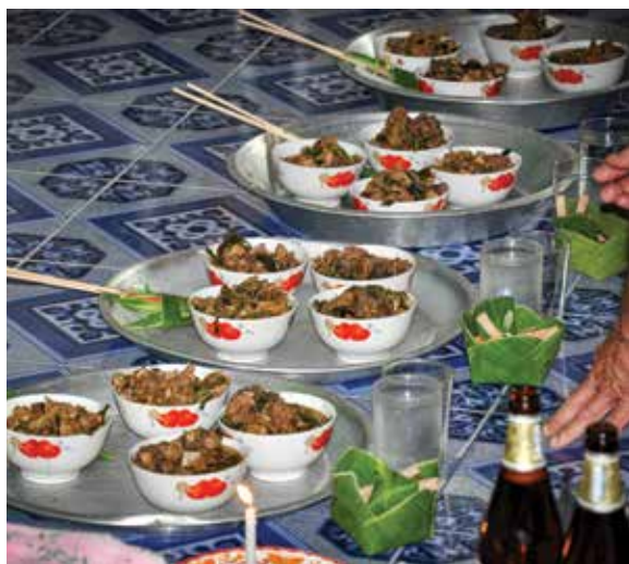
พาอาหารหวาน ๔ สำหรับ ▲ ▲ พาอาหารคาว ๔ สำหรับ

ในระหว่างที่ทำอาหารสำหรับถวายเจ้าพ่อเจ้าแม่ก็นั้นห้ามชิมและดมอาหารเด็ดขาด หลังจากทำอาหารเสร็จเรียบร้อยแล้วจะนำหอนิมนต์มาวางที่หม้ออาหารเพื่อเป็นการบ่งบอกว่าเป็นอาหารสำหรับถวายเจ้าพ่อเจ้าแม่ ห้ามใครนำไปรับประทานก่อนถวายเด็ดขาด