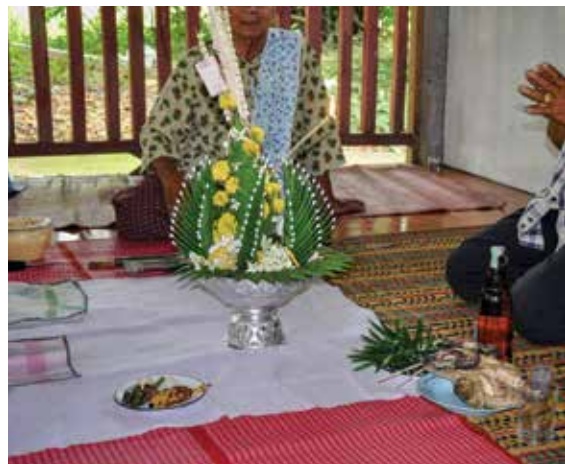
ชั้นนิมนต์ ▲ ▲ พากวัญ

๓. พากวัญ คือ สิ่งที่ใช้ในการประกอบพิธีในการสู่ขวัญ ได้แก่ ชั้นสู่ขวัญ ไก่ต้ม ๑ ตัว เหล้าขาว ๑ ขวด ข้าวเหนียว ๑ กระจิบ น้ำเปล่า ๑ ขวด ผ้าขาวปูรองพื้น ๑ ผืน และพานบายศรีสู่ขวัญ ๑ พาน ที่ทำจากใบตองและนำมาประดิษฐ์ตกแต่งอย่างสวยงามด้วยดอกไม้ หลากหลายสี ซึ่งในบายศรีจะประกอบด้วย เทียน รูป ๙ ดอก ไข่ไก่ ต้ม ๑ ฟอง ข้าวต้มมัด ขนมปัง ใบคูณ ใบเก้าคำ ใบเงิน ใบทอง ฝ่ายผูกแขน ห่อนิมนต์ ๑ ห่อ เงิน กล้วยน้ำหว่าสุก และเครื่องจีบ หมาก จีบพลู