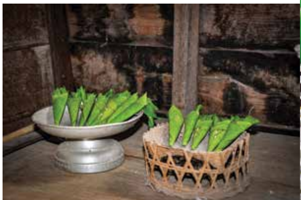
ชั้น์ครอง ▲ ▲ ชั้น์เชิญ ชั้น์ไหว้ หรือ ชั้น์ ๕ ชั้น์ ๘

๕. ชั้น์เชิญ ชั้น์ไหว้ คือ สิ่งที่ใช้ในการประกอบพิธีกรรมต่างๆ ที่เกี่ยวกับเจ้าพ่อเจ้าแม่ โดยในชั้น์เชิญจะใช้สำหรับการอันเชิญเจ้าพ่อเจ้าแม่ ส่วนชั้น์ไหว้จะใช้สำหรับการไหว้เจ้าพ่อเจ้าแม่เท่านั้น ลักษณะของชั้น์ทั้งสองประเภทนี้จะเหมือนกัน แตกต่างกันเพียงการใช้งานเท่านั้น ชั้น์ทั้งสองประเภทจะประกอบด้วย กรวยใบตองอย่างละ ๕ และ ๘ กรวย ซึ่งแต่ละกรวยจะมี จีบหมาก จีบพลู ยามวน (เอาใบตองแห้งมาวนกับยาเส้นที่ชาวบ้านปลุกกันเอง) ๑ มวน ยาเส้น ๑ คำ สีเสียด ๑ คำ หมากแห้ง ๑ คำ ดอกไม้ หรือ ยอดไม้ ๒ ดอก เทียน ๒ เล่ม รูป ๒ ดอก