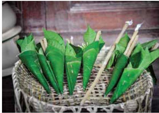
ห่อนิมนต์ ▲ ▲ ชั้นธนิมนต์ (ชั้นธเชิงญ)

๗. งานคารวะ เป็นงานใส่กรวยดอกไม้สำหรับให้ช่างทรง คนใหม่ยกคารวะขอขมาเจ้าองค์ใหญ่ งานคารวะจะต้องเตรียมไว้ ทั้งหมด ๔ งาน แต่ละงานจะใส่ของ ๘ อย่าง ได้แก่ กรวยดอกไม้ (ใบตองทำเป็นกรวยตัดที่ริมปากของกรวยเท่ากัน) ฐูป ๑ คู่ ดอกไม้ ๑ คู่ ยามวน ๑ คู่ จีบพลู ๑ คู่ ยาเส้น ๒ คำ สีเสียด ๒ คำ ผ้าพับ ๑ ผืน