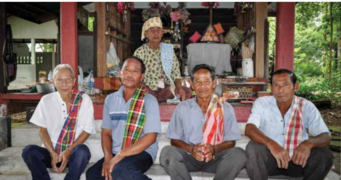
▲ กวนจ๋า ผู้ทำหน้าที่อำนวยความสะดวกในงานพิธี

กวนจ๋า เป็นชายในหมู่บ้านที่ทำหน้าที่คอยรับใช้และอำนวยความสะดวกให้แก่เจ้าพ่อเจ้าแม่ ซึ่งผู้ที่จะมาเป็นกวนจ๋านั้น จะด้วยความสมัครใจอาสาทำหน้าที่เป็นกวนจ๋าเพื่อแลกกับการหายจากอาการเจ็บป่วยที่รักษาไม่หาย ซึ่งแต่ละหมู่บ้านสามารถมีกวนจ๋าได้ไม่จำกัด หน้าที่ของกวนจ๋านั้นจะต้องเป็นผู้จัดเตรียมสถานที่และความเรียบร้อยของการจัดพิธีทุกอย่างที่เกี่ยวข้องกับเจ้าพ่อเจ้าแม่ การจัดเตรียมสถานที่ในหอเลี้ยง การถวายพาช้าว การถอนพาช้าวหลังจากที่ถวายเสร็จแล้ว เมื่อถึงทุกวันพระ ๘ คำ ๑๕ คำ กวนจ๋าจะต้องไปทำความสะอาดที่ครองใหญ่ด้วยและอื่นๆ ตามที่เจ้าพ่อเจ้าแม่ต้องการ