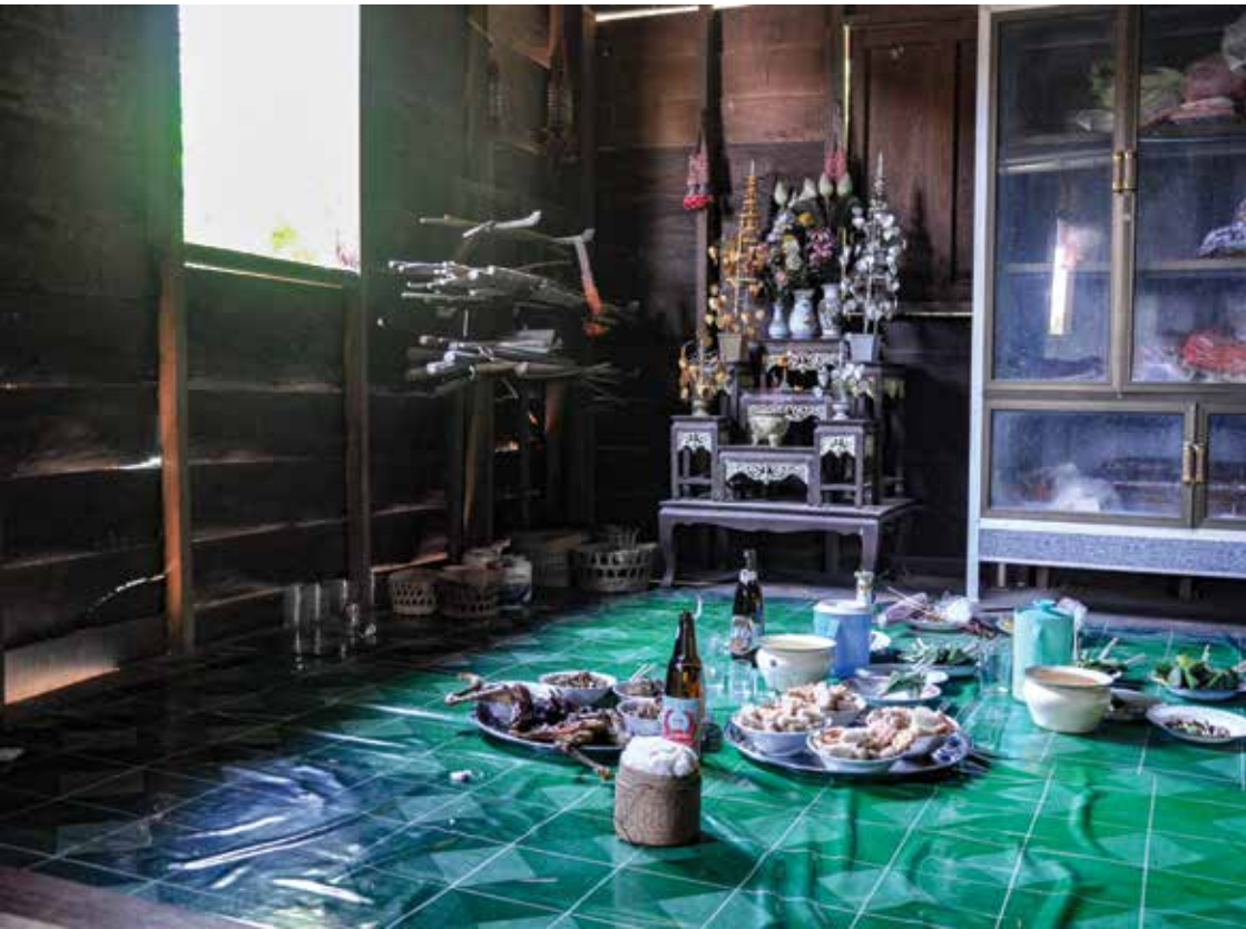
หีบใหญ่ หรือฮีบใหญ่ ▲

๒. หีบใหญ่หรือฮีบใหญ่ เป็นที่สถิตของเจ้าพ่ออู่คำ ตั้งอยู่ที่บ้านร่างทรงคนแรกของเจ้าพ่ออู่คำ ซึ่งในปัจจุบันไม่ว่าร่างทรงเจ้าพ่ออู่คำจะเป็นใครก็ตาม แต่หีบใหญ่จะยังคงตั้งอยู่ที่เดิม แม้ว่าทายาทของตระกูลนี้จะไม่มีการเป็นร่างทรงแต่ก็ต้องดูแลรักษาหีบใหญ่ตามที่บรรพบุรุษสืบทอดกันมา (หีบใหญ่ของบ้านนาทรายจะอยู่ที่บ้านของคุณสายยาง แสนคำ)