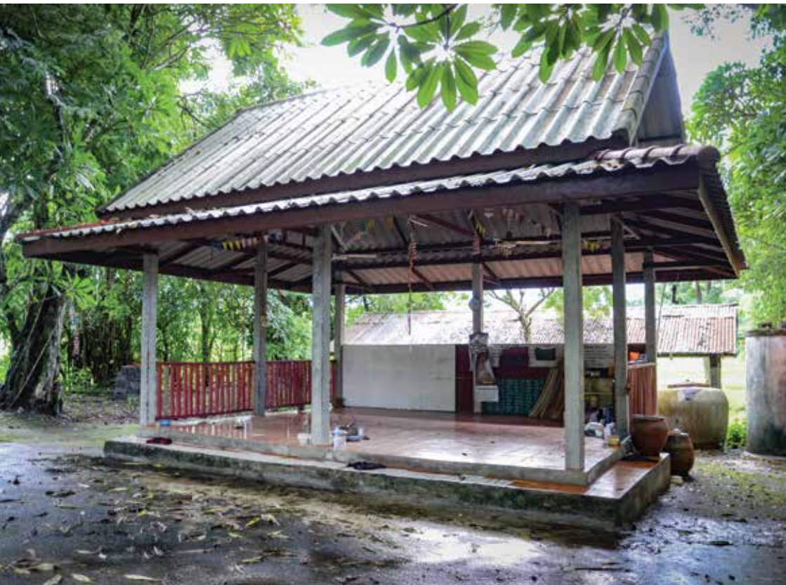
▲ ศาลาจัดเครื่องเซ่นไหว้

๔) ศาลาจัดเครื่องเซ่นไหว้ เป็นสถานที่ไว้สำหรับจัดเตรียมของเซ่นไหว้ที่ใช้ในพิธี และใช้ประกอบพิธีในบางโอกาส รวมถึงการเลี้ยงอาหารช่างทรงเจ้าพ่อเจ้าแม่ และแขกที่มาร่วมงานพิธีแต่ละครั้ง ศาลาหลังนี้จะสร้างอยู่ตรงข้ามกับหอเลี้ยง