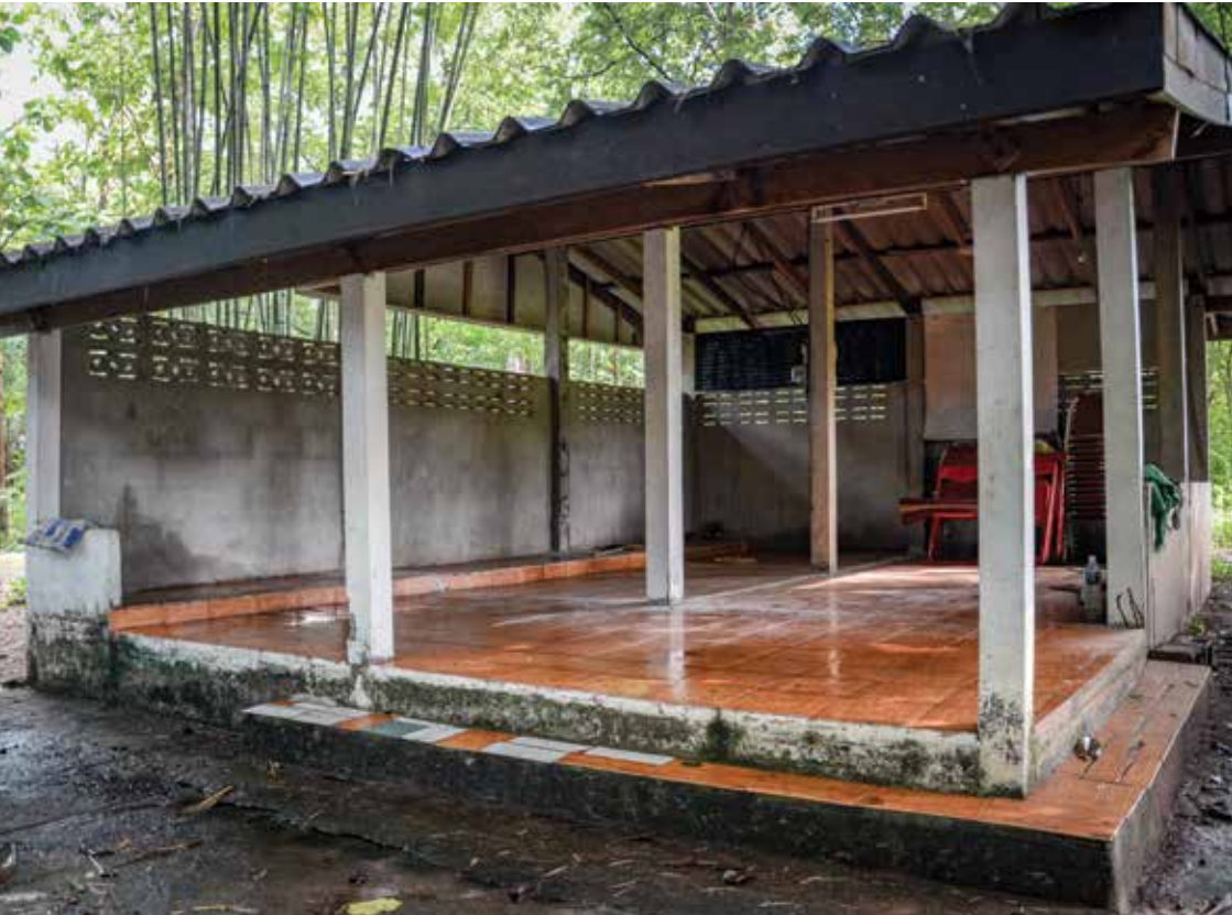
ศาลาหอประชุม ▲

๓) ศาลาหอประชุม เป็นสถานที่สำหรับการประกอบพิธี ประทับร่างทรงและแต่งองค์ทรงเครื่องของเจ้าพ่อเจ้าแม่ ก่อนจะ ประกอบพิธีกรรมต่างๆ