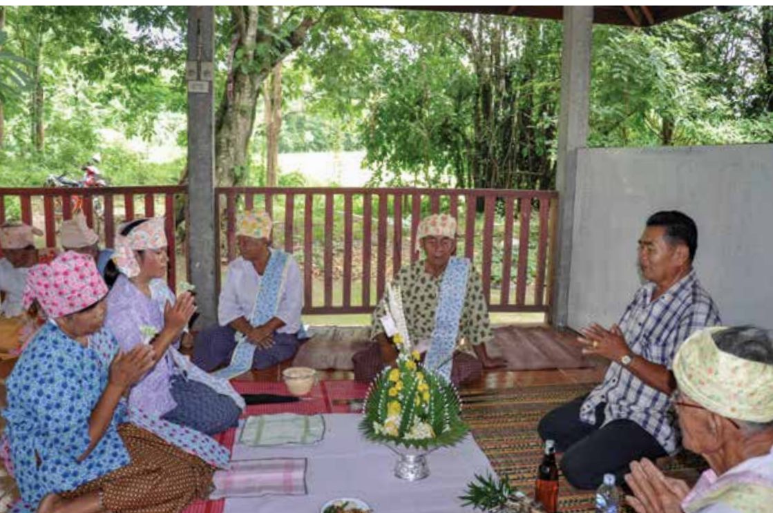
▲ การประกอบพิธีกินตองเจ้าบ้านนาทราย

พิธีกินตองเจ้าบ้านนาทรายเป็นพิธีกรรมที่เกี่ยวข้องกับความเชื่อและความศรัทธาใน “เจ้าพ่อเจ้าแม่” ซึ่งเป็นสิ่งศักดิ์สิทธิ์ประจำหมู่บ้านที่ชาวบ้านให้ความเคารพนับถือ ดังจะเห็นได้จาก “ศาลเจ้า” ที่ชาวบ้านร่วมกันสร้างขึ้นด้วยความศรัทธา และบ้านนาทรายมีสถานที่สำหรับประกอบพิธีกินตองเจ้าอยู่ ๓ แห่ง คือ ศาลเจ้าพ่ออยู่คำ - เจ้าแม่อยู่แก้ว ครอบใหญ่ (หีบใหญ่ / ฮีบใหญ่) และครอบหรือบ้านผู้รับเป็นร่างทรง