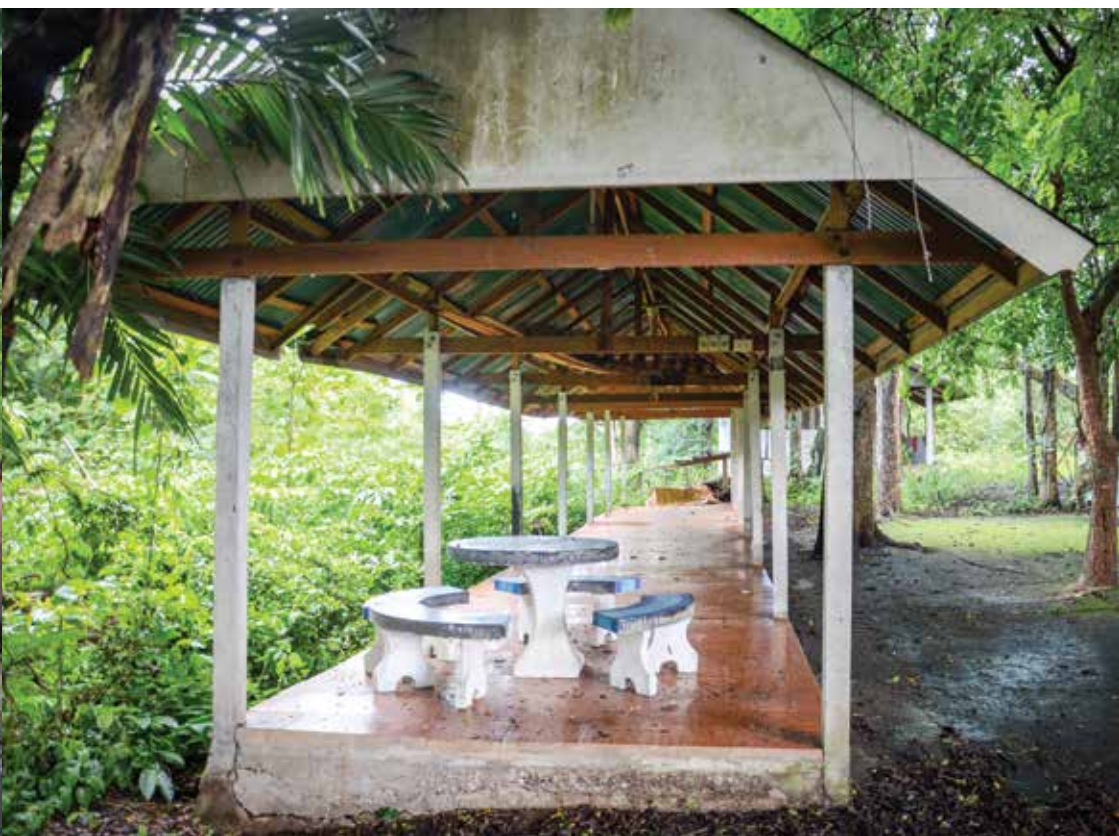
ศาลารับรอง ▲

๕) ศาลารับรอง ศาลาหลังนี้ใช้สำหรับรับรองชาวบ้าน ที่มาร่วมงานพิธีต่างๆ มีลักษณะเป็นศาลาหลังยาวจะอยู่ทางด้านขวา ของหอเลี้ยง